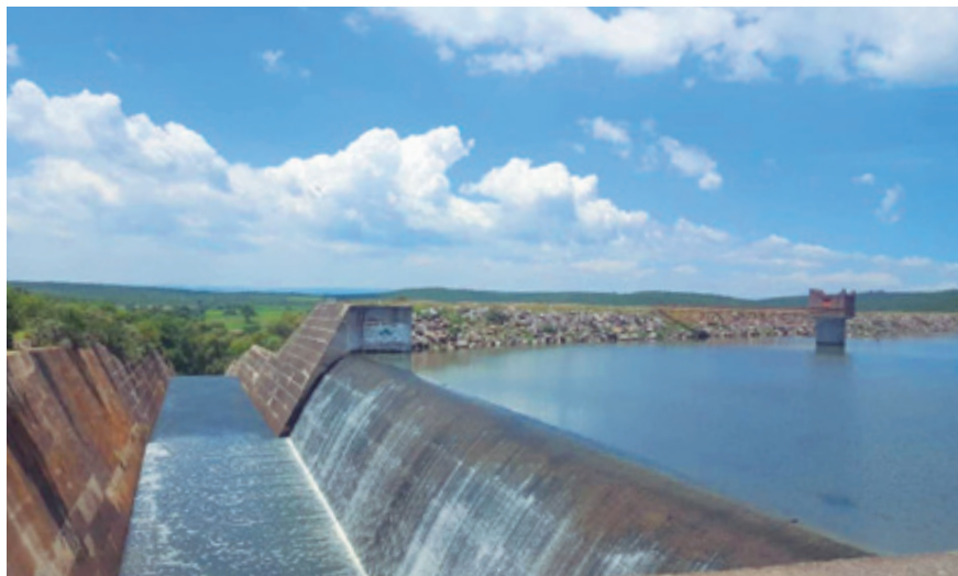
“La Presa Calderón, el sistema Calderón, que es parte del agua que llega a Guadalajara, está a un mes de agotarse; es decir, ya no vamos a poder extraerle el agua que sacamos normalmente de la presa y eso va a implicar un enorme esfuerzo de reorganización interna para garantizar que a la ciudad no le falte el agua”, detalló Alfaro.

(MSEDmetro)” y la instalación formal de la “Mesa de Coordinación de Cultura” y la “Mesa de Coordinación de Gestión Integral del Agua”.