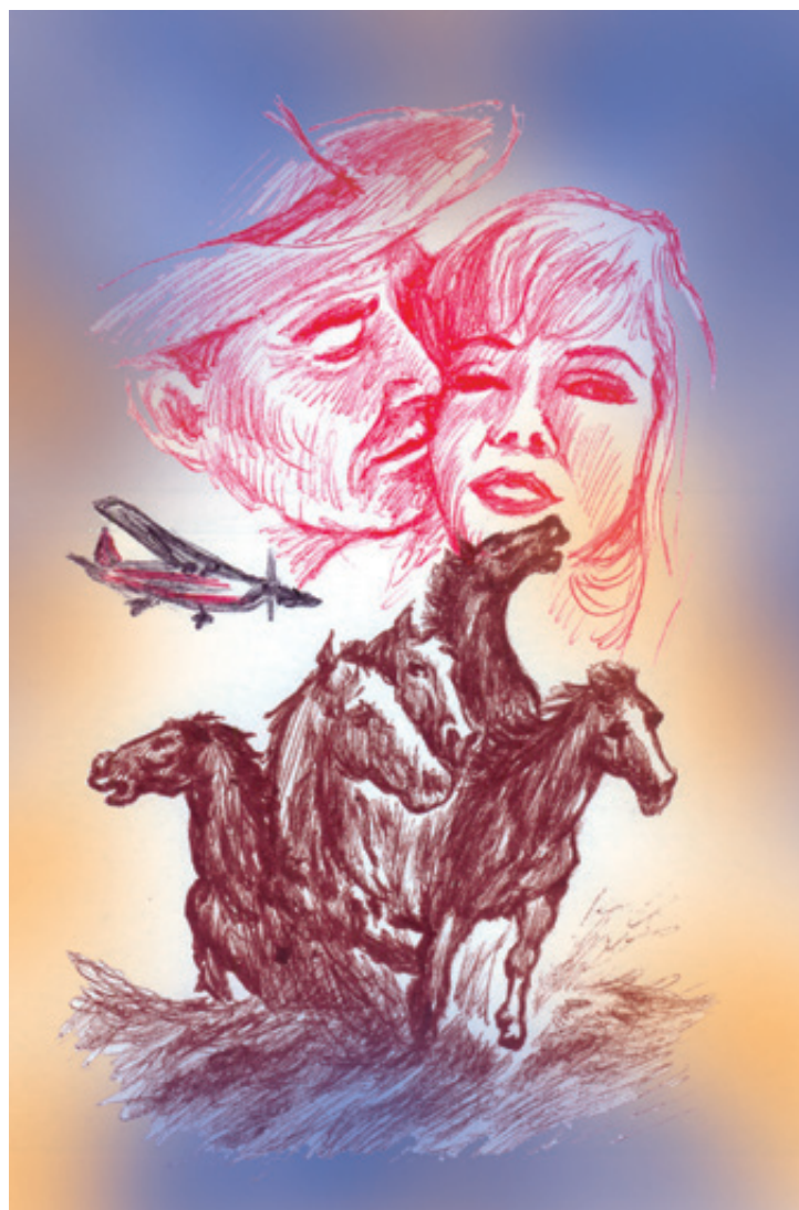
Ilustración: Carlos Mejía

En este relato, Miller, dramaturgo de gran calidad artística y abierta ideología progresista —fue denunciado y condenado durante la campaña anti-comunista orquestada por Joseph McCarthy en los años 50— reunió a un grupo de personajes marginales de su país con el evidente propósito de contrastar su estatus con el de los exitosos “capitanes de industria” y sus empleados, durante uno de los periodos de mayor influencia mercantil, política y cultural del imperialismo yanqui sobre gran parte del mundo. Como guion y novela, Los Inadaptados está a la altura de los dramas y comedias, entre ellas Muerte de un viajante (1949), la antimacarthista Las brujas de Salem (1953), Recuerdo de dos lunes y Panorama desde el puente (1955). En estas obras,