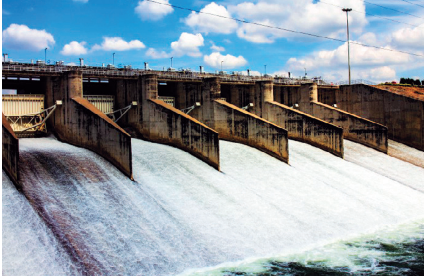
El gobernador de Jalisco firmó un acuerdo con el de Guanajuato para elevar la cortina de El Zapotillo a 105 metros de altura, lo que significa inundar Acasico, Palmarejo y Temacapulín, tres pueblos que están en la cuenca.

proyectos... los promotores privilegiaron el interés particular por encima del interés colectivo, por eso derivó que la sociedad organizada interpusiera el recurso de amparo, y la sociedad organizada ganó todos los recursos”.