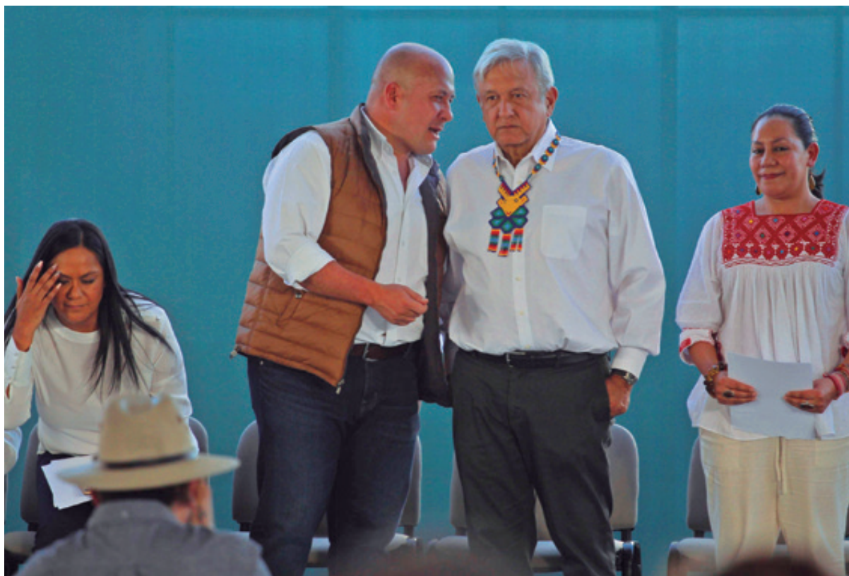
Enrique Alfaro Ramírez propuso al presidente Andrés Manuel López Obrador (AMLO) que retome la construcción de la presa El Zapotillo y el Acuaférico, pero esta solución “política” no remediará pronto el drama cotidiano que agobia a miles de familias.

P ara enfrentar esta situación y pensando en el proceso electoral de junio, el gobernador Enrique Alfaro Ramírez propuso al presidente Andrés Manuel López Obrador (AMLO) que retome la construcción de la presa El Zapotillo y el Acuaférico, pero esta solución “política” no remediará pronto el drama cotidiano que agobia a miles de familias.