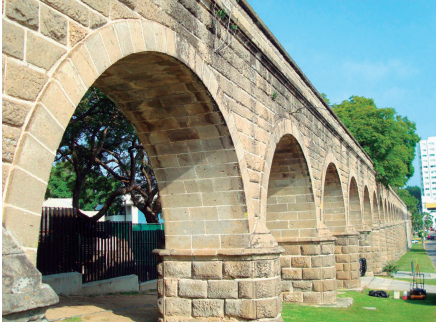
Enrique Alfaro prometió crear el programa Gestión Integral del Agua, que incluía el saneamiento, la rehabilitación, el mantenimiento de la infraestructura hidráulica y la renovación del SIAPA.

varios miles de mdp y tendría que intervenir el Gobierno Federal en su financiamiento, cuya relación política con Alfaro es mala.