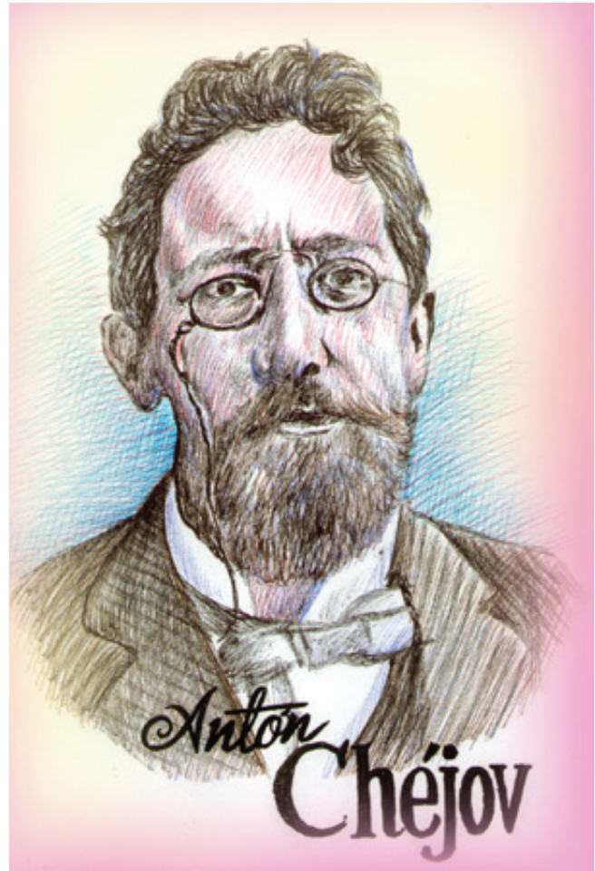
Ilustración: Carlos Mejía

“En toda la ciudad no conocía a un sola persona honrada. Mi padre aceptaba regalías bajo la mano y se figuraba que se los daban por estima a sus cualidades espirituales; los colegas, para pasar de una clase a otra, entraban de pensionistas en casa de sus maestros quienes les hacían pagar fuertes sumas; durante el reclutamiento, la esposa del jefe militar aceptaba regalos de los quintos y hasta permitía que la