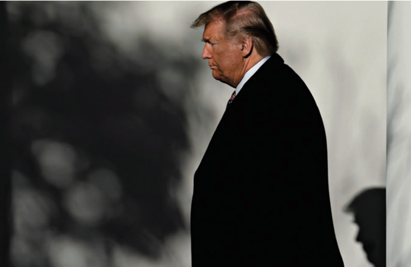
La Universidad de Stanford sostiene que EE. UU. es el mayor mercado global, con más de 30 millones de adictos, casi un millón de muertos por sobredosis en los últimos años y con el repunte de ganancias del Complejo Industrial Militar (CIM). La “guerra” que pretende iniciar Trump, aportaría ganancias para el CIM que lo impulsó para ganar la presidencia.

Toda esa estructura busca abastecer la insaciable adicción de millones de consumidores en el mayor mercado mundial, que es EE. UU. y en el segundo, que es la Unión Europea (UE). Los escasos informes oficiales estadounidenses al respecto revelan una realidad impactante: 21 millones de estadounidenses tienen “al menos una adicción a drogas y solo 10 por ciento recibe tratamiento”.