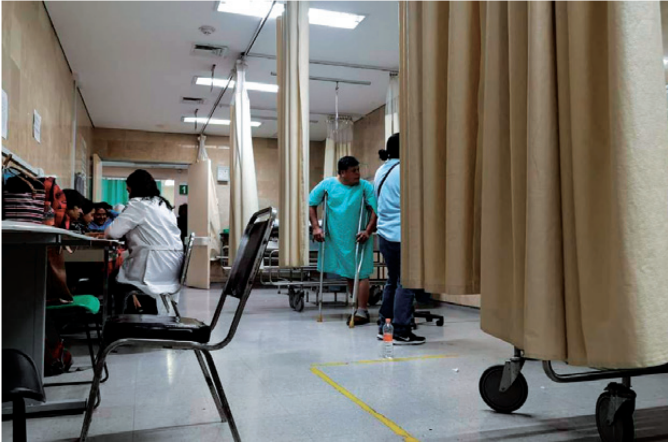
Hace unas cuantas semanas, AMLO visitó nuevamente SLP. En los municipios de Matehuala y Charcas, donde le “llovieron” quejas de los pacientes y el personal médico de las clínicas del IMSS de ambas poblaciones.

E n Charcas, municipio del Altiplano, familiares de pacientes con problemas graves de salud se manifestaron contra las medidas de austeridad durante la visita del presidente Andrés Manuel López Obrador (AMLO) el seis de septiembre. Evidenciaron las dificultades que las personas con VIH SIDA, los niños con cáncer y los pacientes de diabetes, hepatitis, infartos y otras enfermedades crónicas enfrentan actualmente por la falta de medicamentos; también denunciaron el cierre de unidades médicas, la falta de insumos en el Hospital de la Mujer; el retraso de pagos a médicos residentes y la reducción de becas a pasantes.