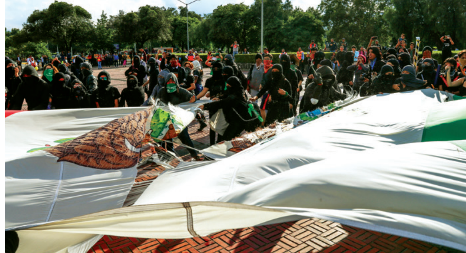
Durante las movilizaciones organizadas por estudiantes destaca la participación de los llamados “bloques anarquistas”, que se identifican por vestir de negro, cubrirse el rostro y, sobre todo, por la ejecución de actos violentos y provocación en protestas pacíficas.

Las autoridades universitarias se comprometieron además a “crear una Unidad de Atención de Denuncias de Violencia de Género (UNAVG)” para que la Oficina Jurídica de la FFyL ya no