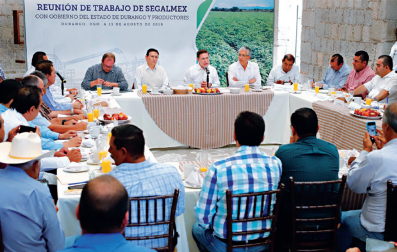
Desde el inicio de este año, Segalmex se dedicó a comprar la misma chatarra alimenticia que se oferta en las tiendas de conveniencia de moda –Oxxo, Extra, etc.– para venderla en las tiendas Diconsa.