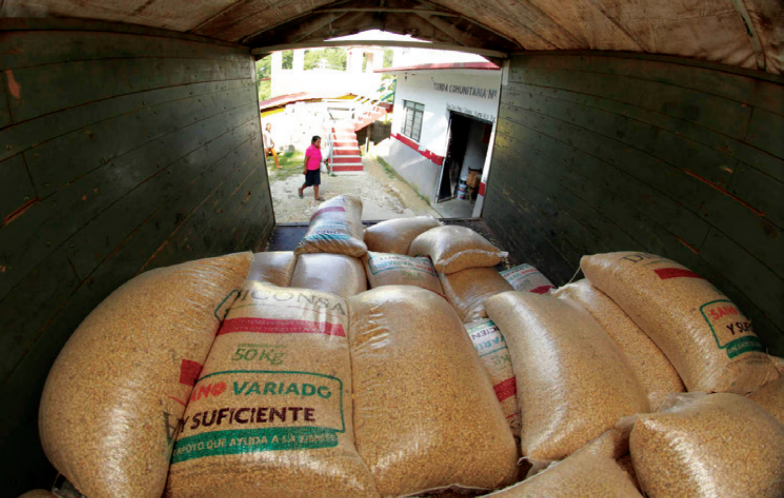
El Diario Oficial de la Federación publicó el día 18 de enero el decreto con el que se crea el organismo Seguridad Alimentaria Mexicana (Segalmex); la institución estará descentralizada y tendrá personalidad jurídica propia. La Secretaría de Agricultura y Desarrollo Rural (Sader) será la encargada de coordinar sus actividades.

H oy, las tiendas Diconsa –remanente histórico de la Conasupo y punto de partida para la Segalmex– no solo venden todo tipo de productos industrializados, entre ellos los alimentos chatarra, sino que además, el Gobierno Federal les ha agregado una función bancaria para que operen como cajeros automáticos, reciban el pago de servicios públicos y vendan “tiempo-aire” de telefonía móvil, transacciones con las que los principales beneficiarios son los grandes corporativos bancarios, agroalimentarios y refresqueros en perjuicio de los pequeños comerciantes. Pero el impacto de este rediseño operativo no se limita al ámbito comercial y bancario, sino que al renunciar al objetivo original de Conasupo, que consistía en sustituir importaciones y reducir la dependencia alimentaria con respecto