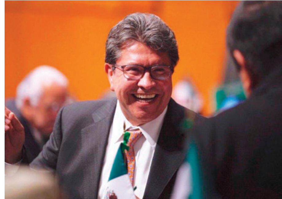
Ricardo Monreal, coordinador de Morena en el Senado, amenazó con iniciar procesos de desaparición de poderes en otros estados si el PAN insiste en el tema.

Es decir, la Cámara de Senadores no puede desaparecer los poderes de