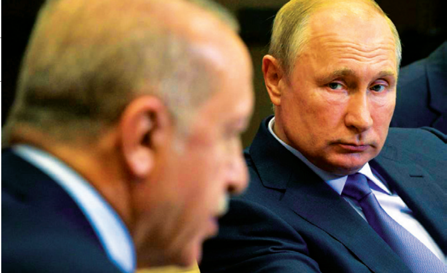
Erdogan jugó sus cartas (la “ayuda” a refugiados sirios y la lucha “antiterrorista”) para que EE. UU., Rusia e Irán consintieran con su operación. Sin embargo, Putin enfatizó que esa acción antiterrorista es válida “siempre que no sobrepase los objetivos territoriales pactados y amenace la seguridad del gobierno sirio”.

gobierno legítimo de Siria “decide que no necesita más de las Fuerzas Armadas rusas esto también se aplicará a nosotros, por supuesto”. En otro viraje de su diplomacia, Putin logró que la canciller alemana, Ángela Merkel, apoyara su arreglo político para estabilizar Siria, el cual se basó en principios de unidad e integridad territorial del país.