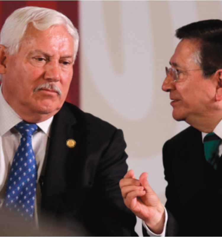
Víctor Villalobos Arámbula, secretario de Agricultura y Desarrollo Rural (Sader), e Ignacio Ovalle Fernández, director general del organismo Seguridad Alimentaria Mexicana (Segalmex), durante la conferencia matutina donde informó sobre los apoyos al sector agrícola.

los productores y en contra de los consumidores y una ausencia del Estado para resolver estos problemas tan profundos que aquejan a nuestro campo mexicano”. Esto se debe a que desde el inicio de este año, Segalmex se dedicó a comprar la misma chatarra alimenticia que se oferta en las tiendas de conveniencia de moda –Oxxo, Extra, etc.– para venderla en las tiendas Diconsa, cuya histórica tarea comercial consistía en rescatar la alimentación sana en las zonas rurales empobrecidas a precios más bajos. El 14 de julio se difundió que en el primer semestre de 2019 Segalmex compró 47 millones de pesos (mdp) en productos chatarra a corporativos para venderlos en sus tiendas populares Diconsa. Según la información