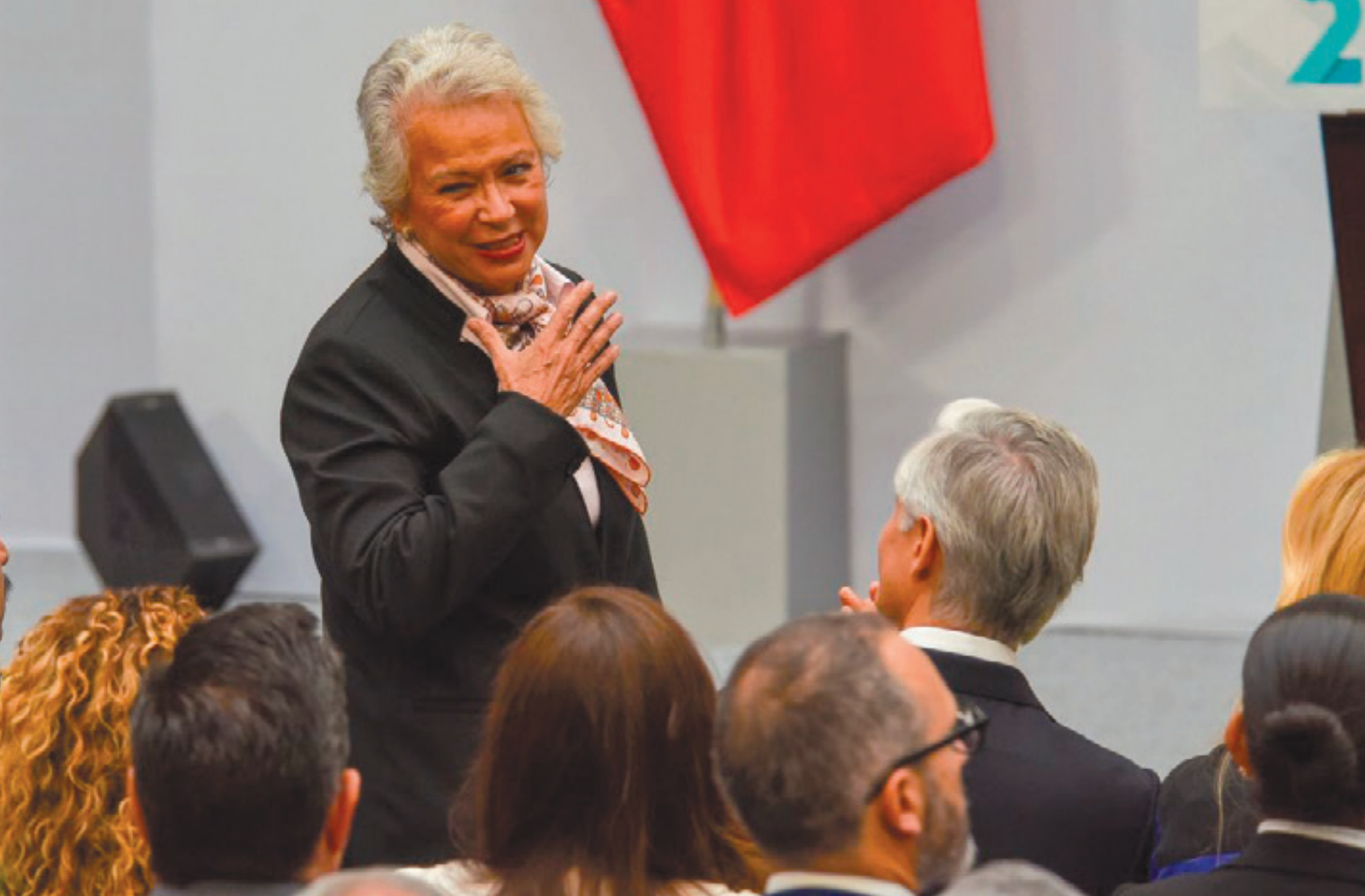
La Secretaria de Gobernación, Olga Sánchez Cordero, desestimó que vaya a declararse la desaparición de poderes en Veracruz, Guanajuato y Tamaulipas.

Para el ministro en retiro de la Suprema Corte de Justicia de la Nación (SCJN), José Ramón Cossío, la remoción de poderes es una práctica del priismo centralista del siglo XX. “Entre 1917 y 1978 se declararon desaparecidos, efectiva y realmente, 20 poderes de los estados. Eran momentos en los que los gobernadores o los congresos (locales) se