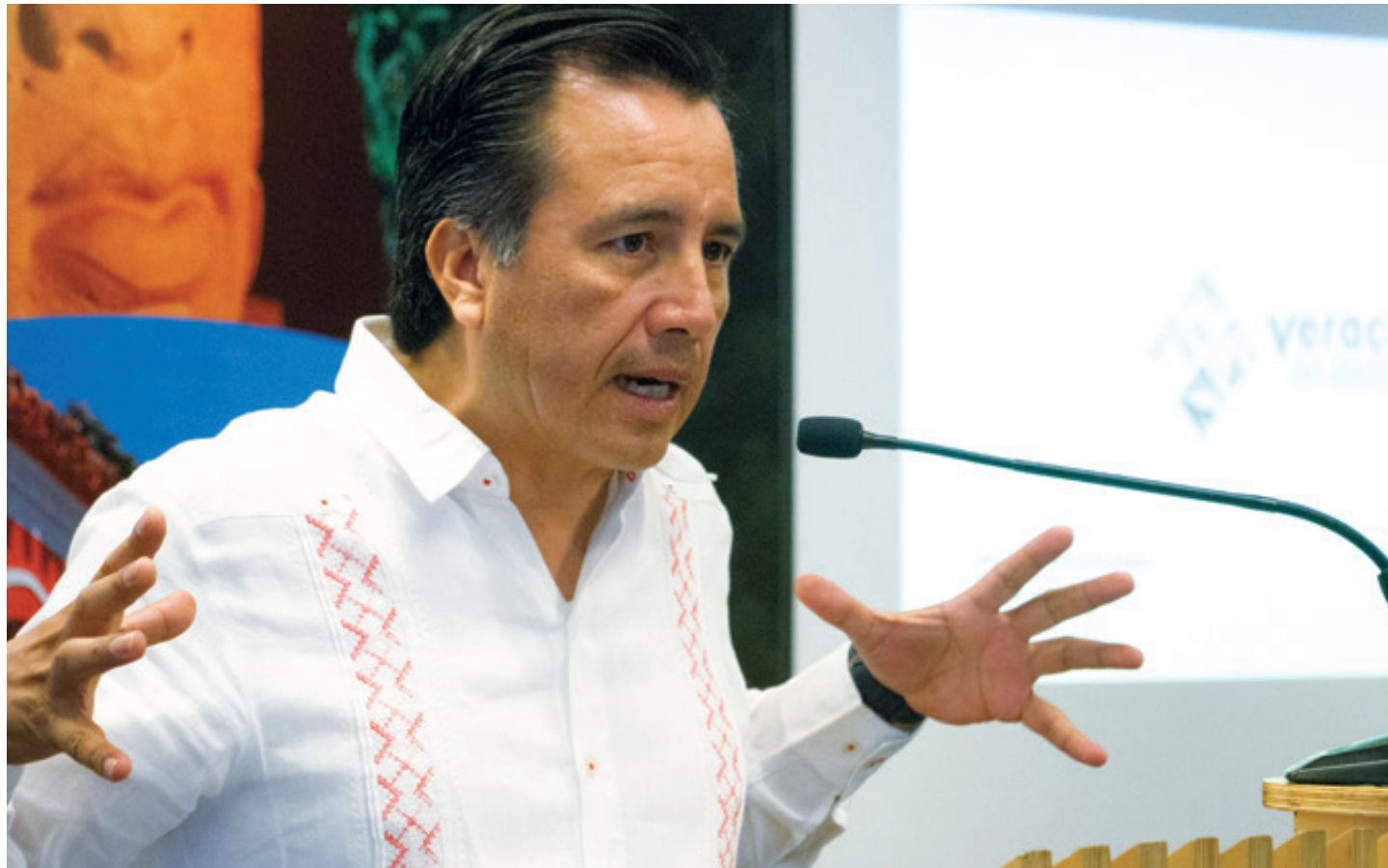
Veracruz es un estado fallido por la indolencia, falta de capacidad y constante violación al Estado de Derecho por parte de los legisladores locales de Morena (mayoría en el Congreso) y del gobernador Cuitláhuac García Jiménez.

E l coordinador de Morena en el Senado, Ricardo Monreal, aclaró que era “una solicitud normal frente a la presentada en Veracruz”, previamente impulsada por el PAN. “Lo más correcto sería actuar con mucha prudencia. Llamo a la cordura. Es un asunto delicado lo que pasa en Tamaulipas. No quiero adelantar vísperas, serán las comisiones las que definan”, señaló el legislador.