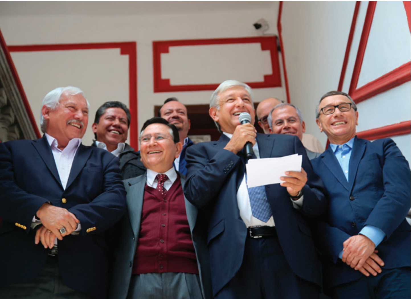
Las futuras 27 mil tiendas de Segalmex no solo aspiran a competir por la clientela con Oxxo y sus 18 mil puntos de venta de productos chatarra, pagos de servicios públicos, cajero automático y telefonía móvil, sino también su eficiente modelo de negocio, con lo que difícilmente podrá revivir el de la antigua Conasupo.

millones 500 mil campesinos registrados en 2015, de los cuales 55 por ciento son agricultores y 44 por ciento peones o jornaleros sin tierra. Resulta evidente la caída de la producción nacional y el aumento de las importaciones de EE. UU. Entre enero y mayo de 2018, México importó seis millones 169 mil toneladas de maíz y exportó 429 mil toneladas, cifra equivalente al siete por ciento del total importado; 98 por ciento de las importaciones del grano proviene de EE. UU. –según acuerdo con el Grupo Consultor de Mercados Agrícolas (GCMA)– donde para su cultivo se utilizan semillas transgénicas y el pesticida Glifosato, altamente peligroso para la salud humana, y comercializado por el corporativo Monsanto, que fue comprado el