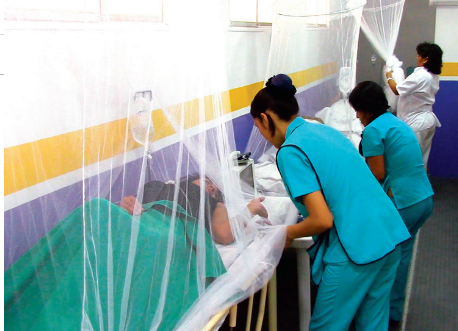
A los médicos les ordenan cambiar la causa de muerte de los enfermos por dengue para que la epidemia no sea vista en su magnitud real. “Se nos ordena que le pongamos diabetes, insuficiencia renal, neumonía... quieren bajar las cifras a fuerzas”.

Además reveló que no hay criterio y responsabilidad ética, ya que ha sido testigo de que a los médicos se les ordenan cambiar la causa de muerte de los enfermos por dengue para que la epidemia no sea vista en su magnitud real. “Se nos