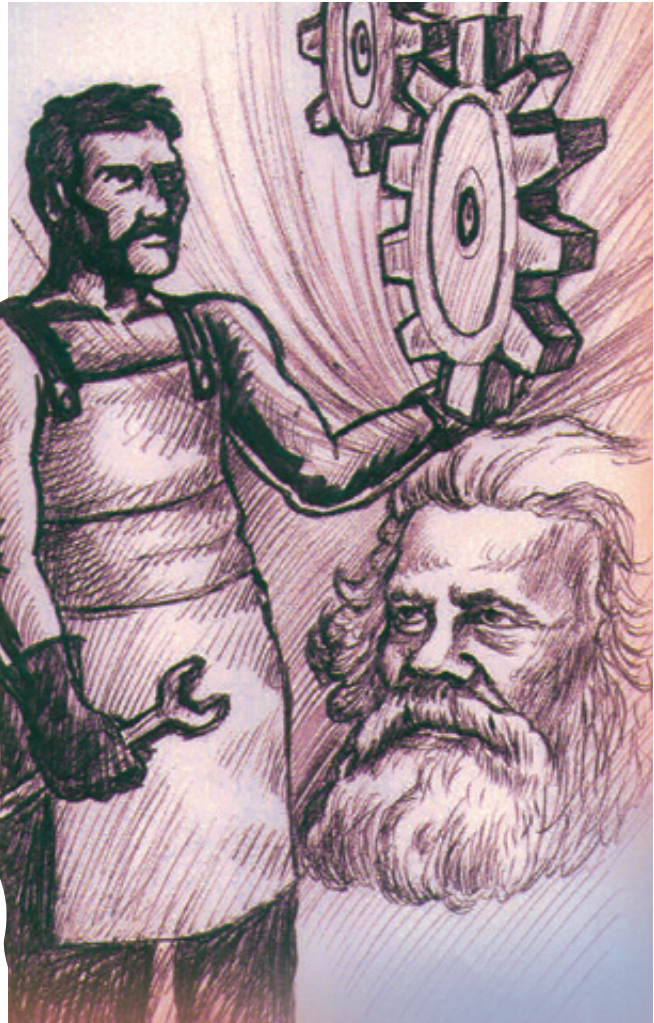
Ilustración: Carlos Mejía

“El capitalismo no necesita decir gran cosa mientras evade un desplome repentino como el de 1931 y, después de todo, ha aprendido bastante de lo que sucedió en los años 30. El capitalismo puede refugiarse en la lógica del mercado, como me explicó un millonario neoyorquino pocos días después de la quiebra de la bolsa de comercio: Más pronto o más tarde el mercado vuelve a encontrar un nivel apropiado, con tal que en el intervalo evitemos la revolución.