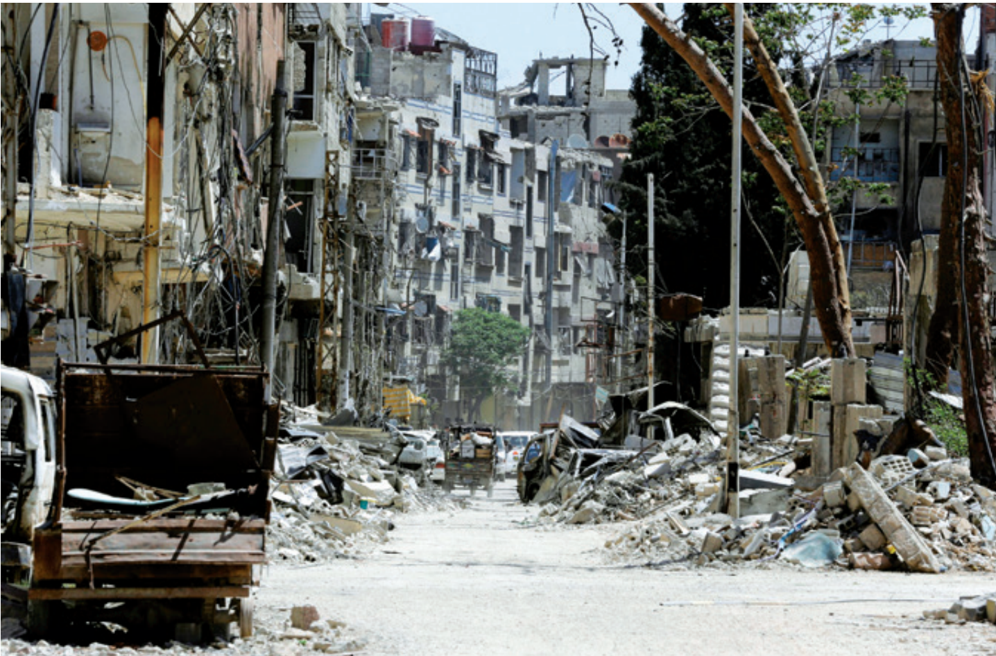
EE. UU. parece hoy un imperio sin lógica: tras la larga y fallida operación “antiterrorista” contra el EI del entonces presidente Barack Obama en 2016, el candidato Donald Trump sostuvo que su país debía salir de Siria.

Entretanto, Rusia pactó la protección a los kurdos, acompañando a las tropas ➤