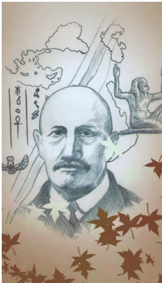
Ilustración: Carlos Mejía

Configurada hoy por Turquía y Armenia en el norte; Irán (Persia) en el oriente; Mesopotamia en el centro; Siria, Palestina y Egipto en el poniente y la Península Arábiga en el sur, la región también denominada Asia Menor fue sucesivamente dominada entre los 1000 y 700 a.n.e. por reyes asirios, caldeos, acadios y babilonios (semitas); del 700 al 600 a.n.e. por egipcios asiáticos; lidios, cilicios, capadocios e hititas (turcos), y de los años 600 y 500 a.n.e. por medos y partos (persas). En el repaso sucinto de Hogarth aparecen los nombres de Assurbanipal, Nabucodonosor, Sargón, Cambises, Ciro, Darío, Alejandro de Macedonia y finalmente los herederos multinationales de éste en Siria y Egipto: Seleuco y Ptolomeo. Los griegos, quienes poblaban las áreas costeras de Asia Menor,