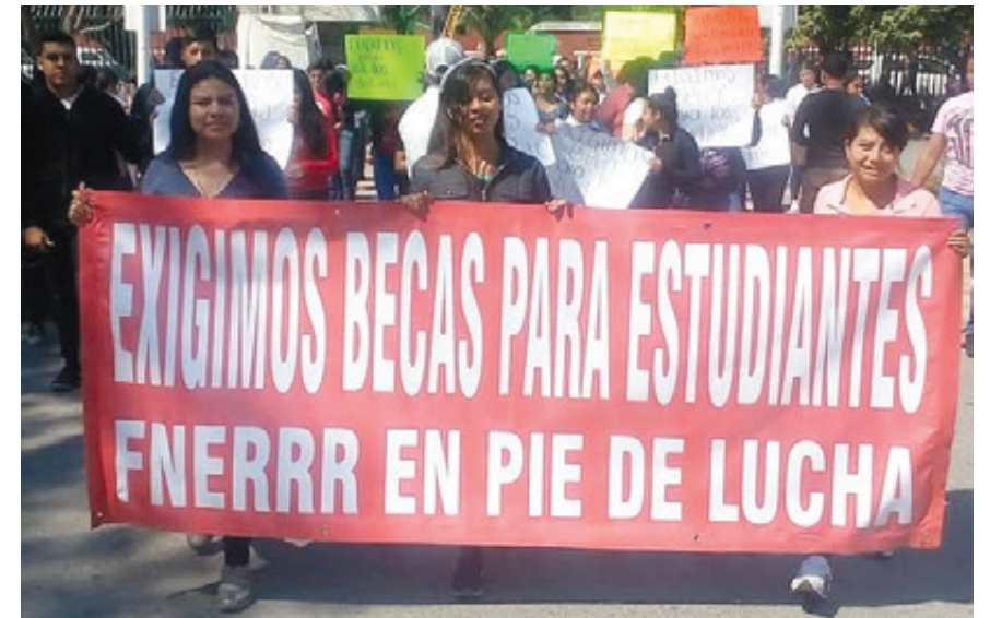
En México, 2.2 millones de adolescentes abandonan la escuela por falta de recursos económicos y el 14.4 por ciento de ellos se ve en la necesidad de buscar un trabajo para ayudar a su familia, según cifras del Inegi.

Por otro lado, Carlos Muñoz Izquierdo, especialista en planeación educativa y economía de la Ibero, afirmó que la distribución inequitativa de las oportunidades de acceso, permanencia y aprendizaje es el factor que más influye en el deficiente desempeño del sistema educativo.