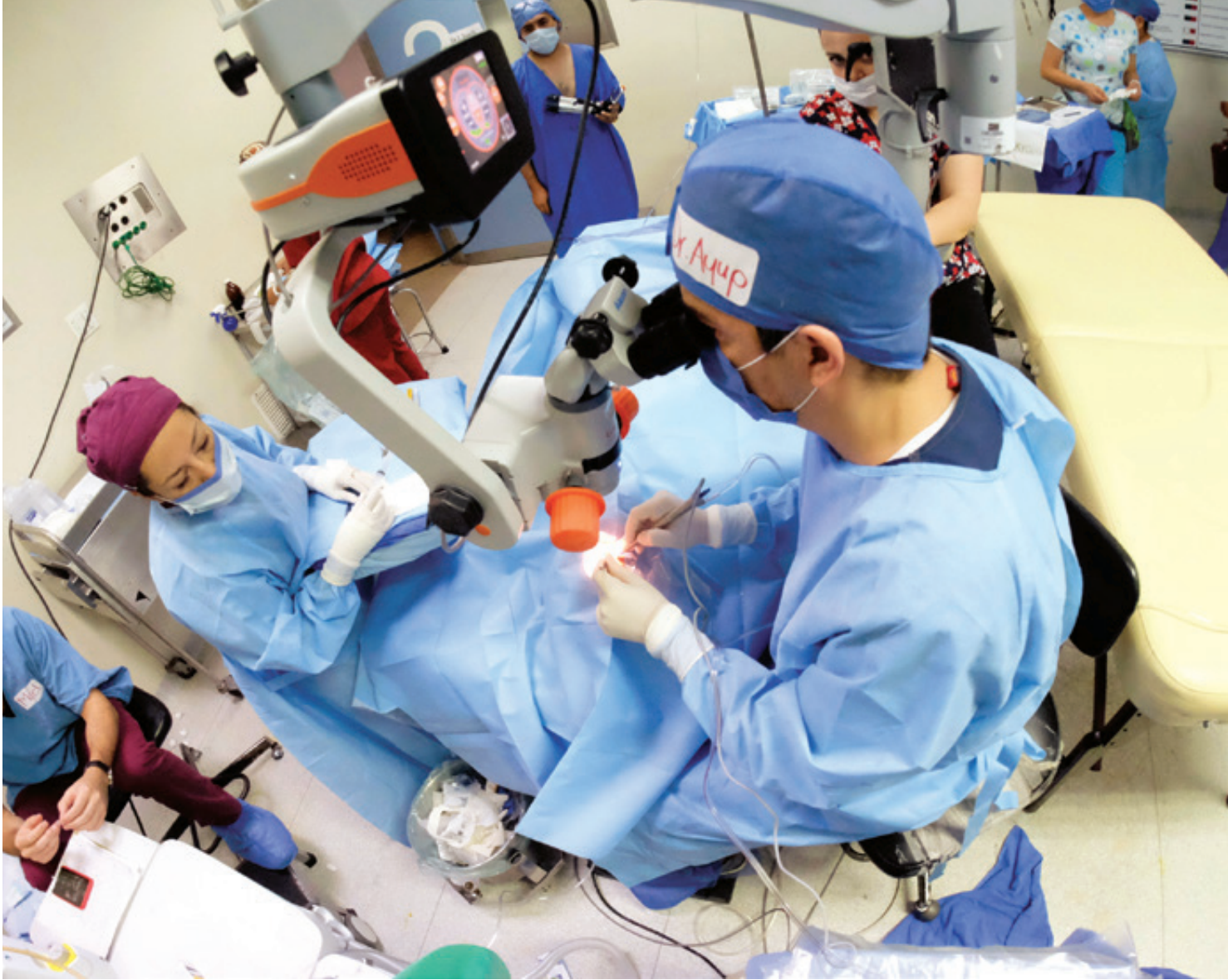
De los 70 contratos que hasta entonces había concertado el IMSS, el 61 por ciento fueron por asignación directa.

concertado, el 61 por ciento fueron por asignación directa. La Secretaría de Comunicaciones y Transportes (SCT) había entregado el 69 por ciento de sus obras a empresas privadas mediante licitación pública y 47 contratos por adjudicación directa. La CFE es otra de las entidades que ha optado por la adjudicación directa con 27 contratos y 664 por licitaciones públicas, fueron los datos del Observatorio. Otras dependencias federales con adjudicaciones directas son: el Instituto de Seguridad y Servicios Sociales y Pensiones de los Trabajadores del Estado (ISSSTEP), con siete; el Fondo Nacional de Fomento al Turismo (Fonatur), con 13 y la Secretaría de Agricultura y Desarrollo Rural (Sader), con seis. En el caso de Fonatur, su propio director, Rogelio Jiménez Pons, reveló al diario El Financiero que para el arranque del Tren Maya se habían adjudicado dos contratos por vía directa con un monto mayor a los 200 millones de pesos. Uno a la empresa inglesa Steer Davies, encargada de diseñar el Plan Maestro para el proyecto ferroviario de mil 525 kilómetros en el sureste