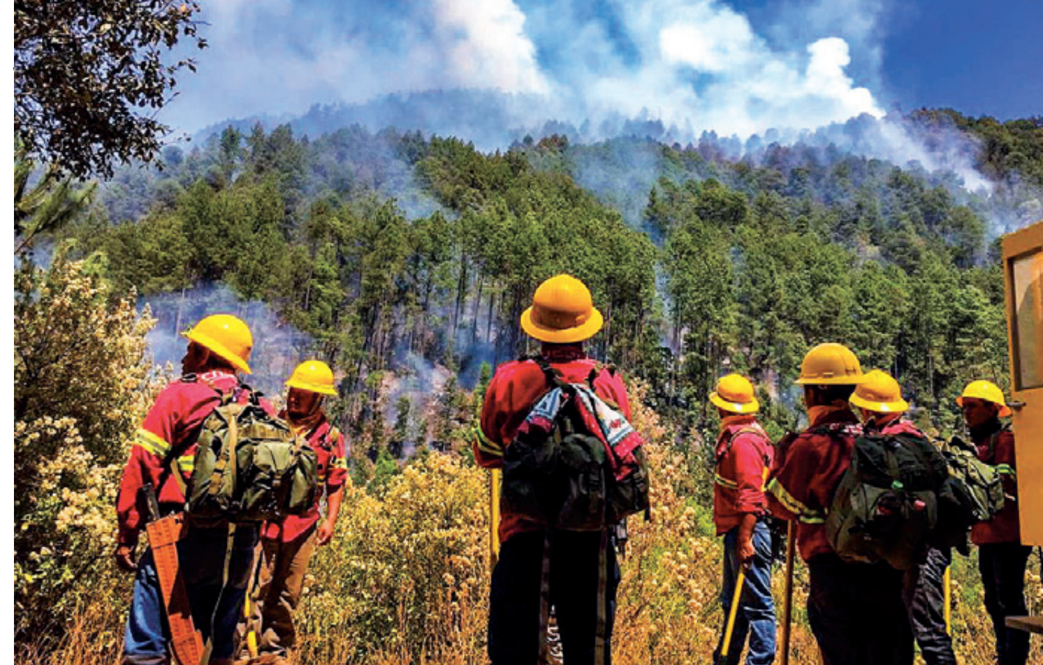
El gobierno del Estado de Oaxaca facilitó un helicóptero (pág. op.) a la Coesfo para movilizar brigadas y arrojar agua con un aditamento especial. Brigadistas (arriba) combatiendo inmensos y voraces incendios forestales en diversas zonas de Oaxaca.

Esta propuesta obligó a los diputados locales a reconocer que el Presupuesto de Egresos estatal 2019 no previó el gasto adecuado para combatir este tipo flagelos y los llevó a comprometerse a poner más atención a éstos en el proyecto de gastos de 2020, según declaración del diputado morenista, Ángel Domínguez Escobar.