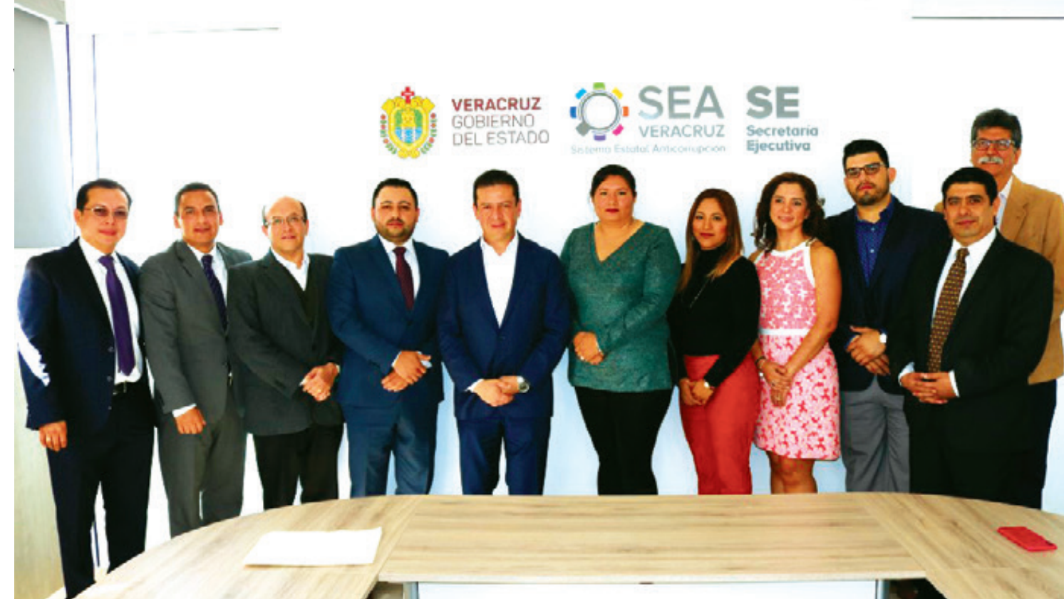
Veracruz está reprobado en calidad de los servicios públicos con el 1.9 de calificación; en cuanto a corrupción en las instituciones de seguridad pública y seguridad social, apenas alcanza 3.1 puntos.

Este modelo, dijo, ya aplica en la legislación ordinaria en el caso de la Comisión Estatal de Derechos Humanos (CEDH) y la Universidad Veracruzana (UV), y agregó que con esta reforma se abonaría a la construcción de entes públicos con mayor fortaleza institucional y capacidad de operación financiera.