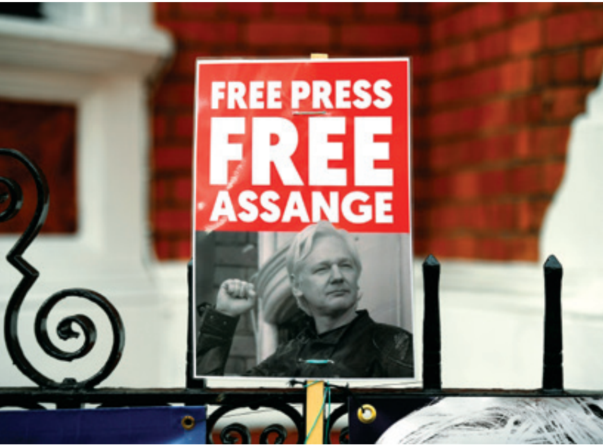
Assange se ha declarado inocente y no ha sido formalmente acusado de nada. La polémica rodea ese proceso por la falta de solidez en las denuncias.