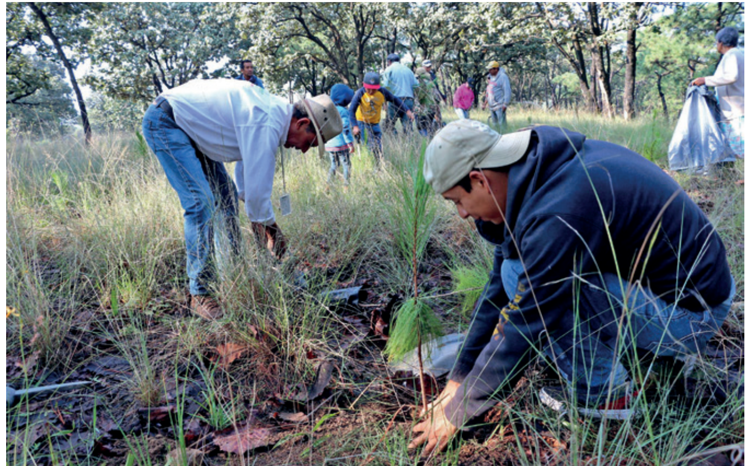
En lo que va del año se han registrado 145 incendios en Jalisco. Los investigadores acusan al PVEM de hacer demagogia con la reforestación, que ha sido parcial e ineficiente.

Una fuente fidedigna, que solicitó no ser identificada para evitar consecuencias negativas a su persona, confirmó este dato y explicó que la mayoría de los trabajadores despedidos eran eventuales y se les prometió que serían llamados en caso de emergencia, pero hasta el momento no se les ha vuelto a llamar. Esos bomberos terminaron sus contratos en diciembre de 2018.