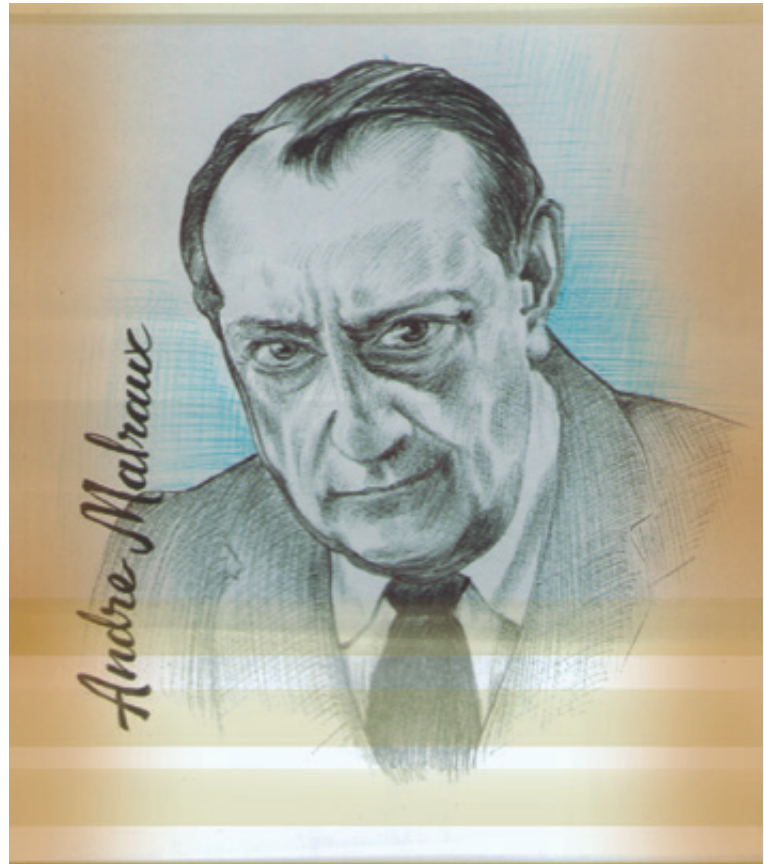
Ilustración: Carlos Mejía

En 1939 fue movilizado para la defensa de Francia ante la invasión nazi; estuvo al frente de la brigada Alsacia-Lorena, con grado de coronel; fue hecho prisionero, escapó