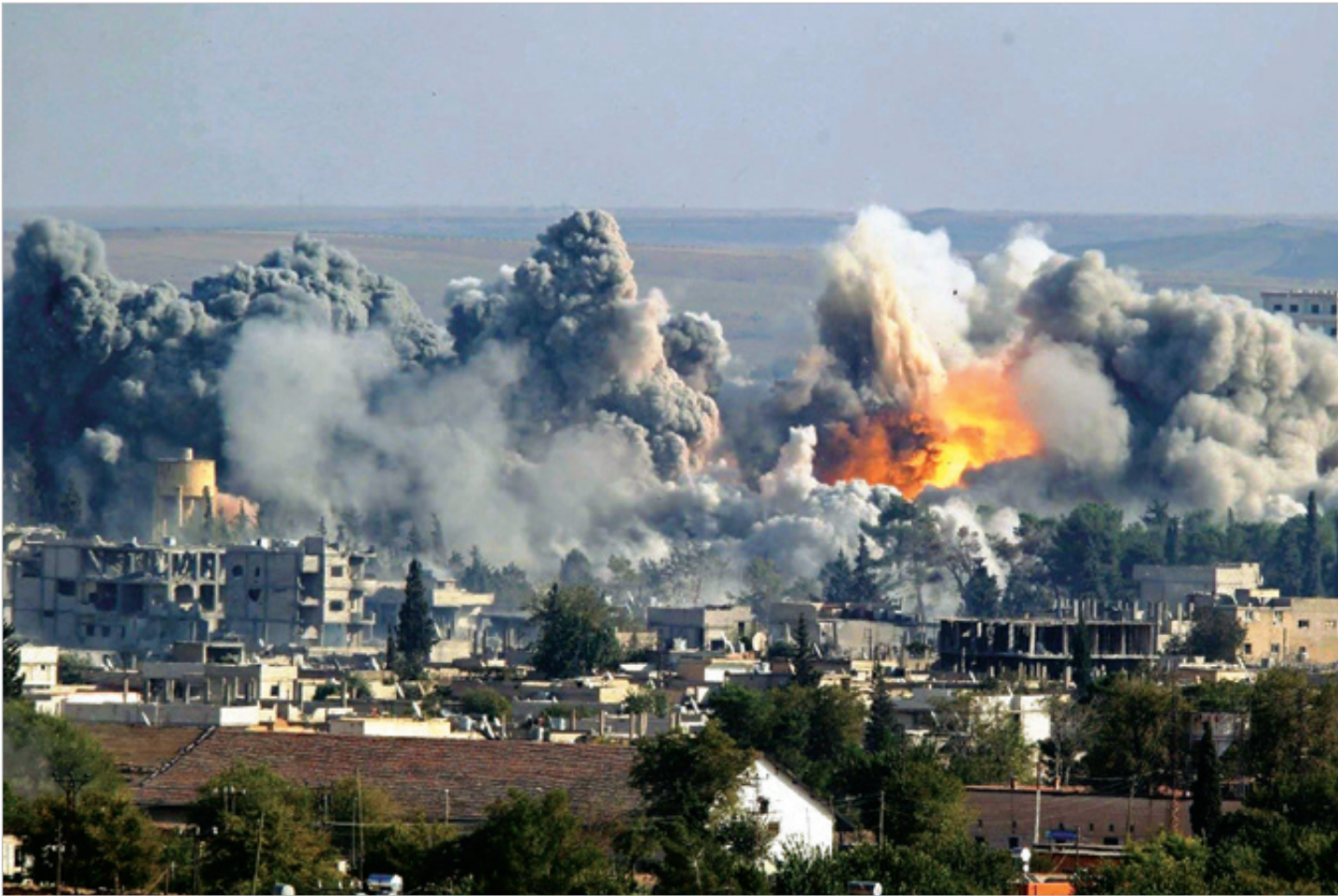
A ocho años de la intervención de la OTAN, el escenario post-Khadafi es tan dantesco que Occidente lo ha abandonado a su suerte.