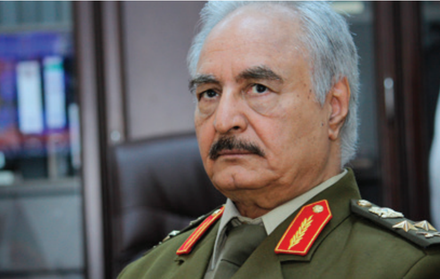
El primer ministro e ingeniero Fayeza Sarraj es respaldado por la Organización de las Naciones Unidas (ONU) y la comunidad internacional, aunque su poder es mínimo en el resto del país.

En Libia hay dos “gobiernos”: uno en la capital, Trípoli, y otro en Tobruk. Ambos se disputan el favor occidental y el apoyo de las múltiples facciones políticas que hace ocho años surgieron tras la descomposición del país más rico del Magreb y hoy uno de los más pobres del planeta. Ese Estado fallido es el saldo de la intervención de Estados Unidos (EE. UU.) y la Unión Europea (UE), a través de la OTAN para cambiar el régimen de Muammar el Khadafi.