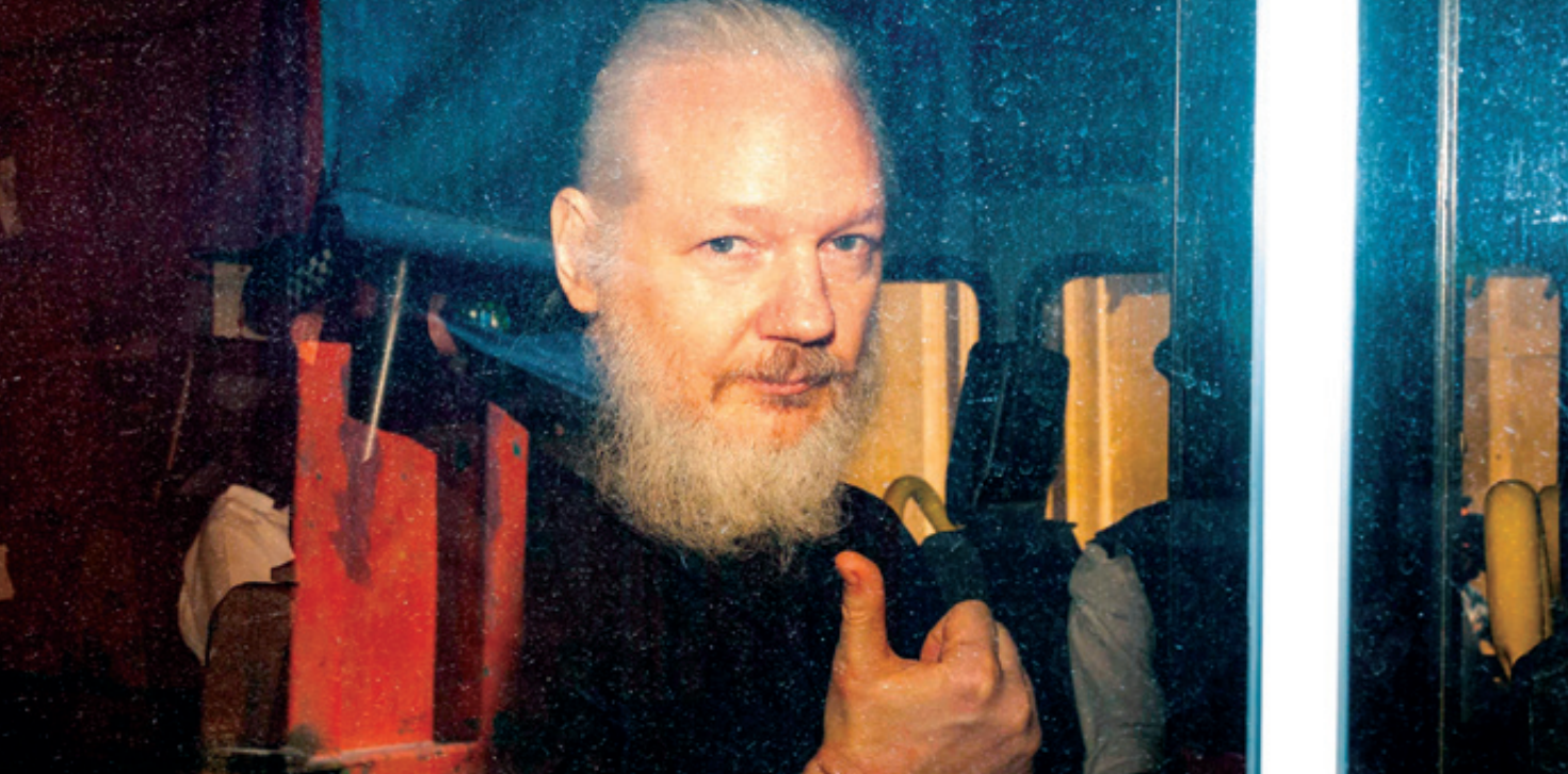
Millones reconocen a Assange y al excontratista de la Agencia Central de Inteligencia (CIA) del gobierno de EE. UU., Edward Snowden, por alertar a la sociedad del impacto que contra ella tienen las políticas y acciones encubiertas de los gobiernos imperialistas.