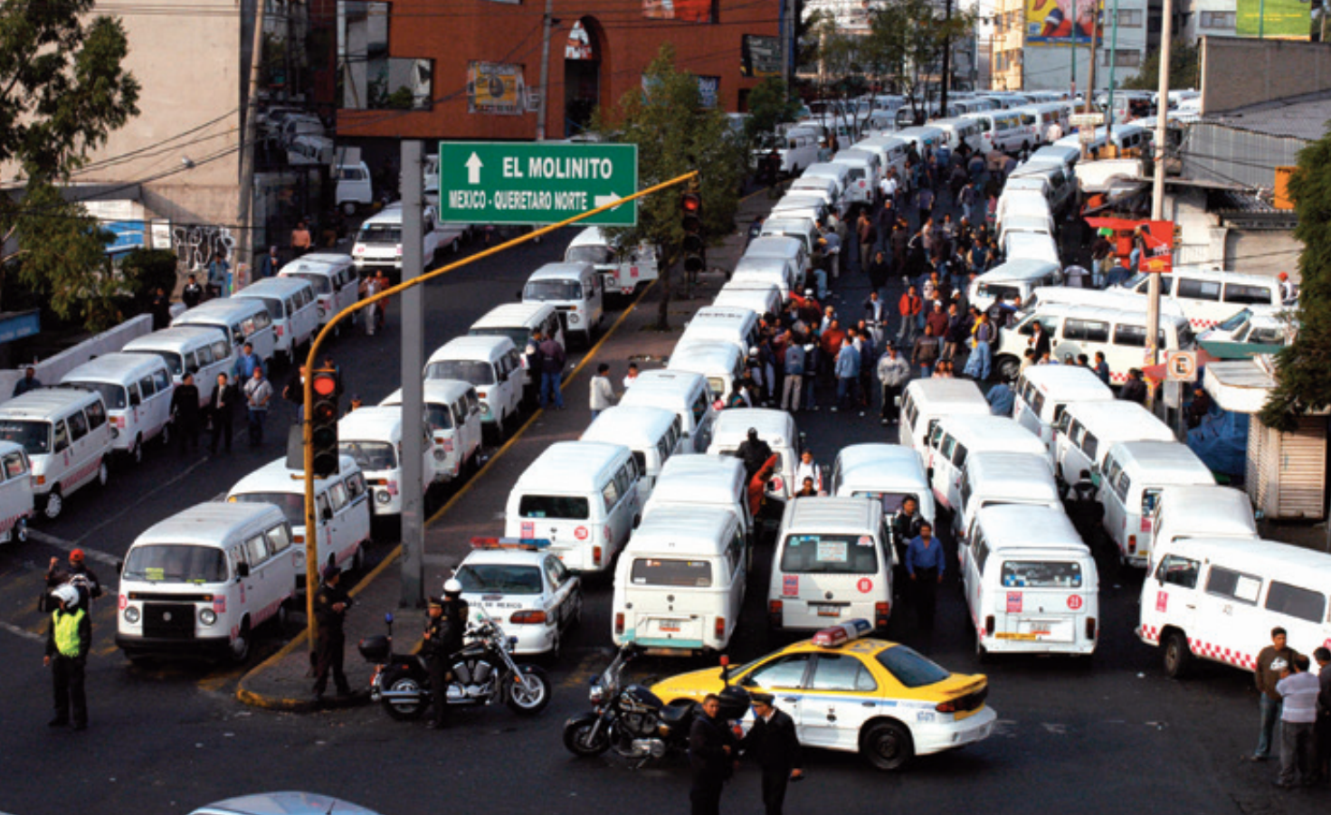
De lunes a viernes, dos millones 244 mil 877 personas se trasladan de diversos municipios de la zona conurbada de la entidad mexiquense a la capital del país.