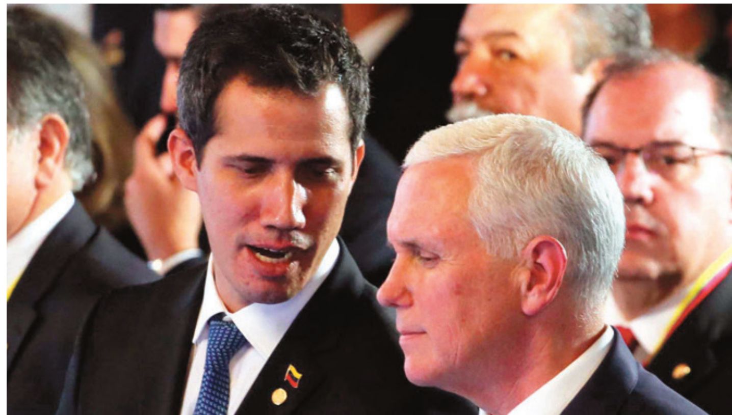
“A usted, presidente Guaidó, un muy simple mensaje del presidente Trump: estamos con usted 100 por ciento”, dijo Pence durante una reunión entre ambos en el marco de una cita del Grupo de Lima.

Días antes, el secretario del Consejo de Seguridad ruso, Nikolái Patrushev,