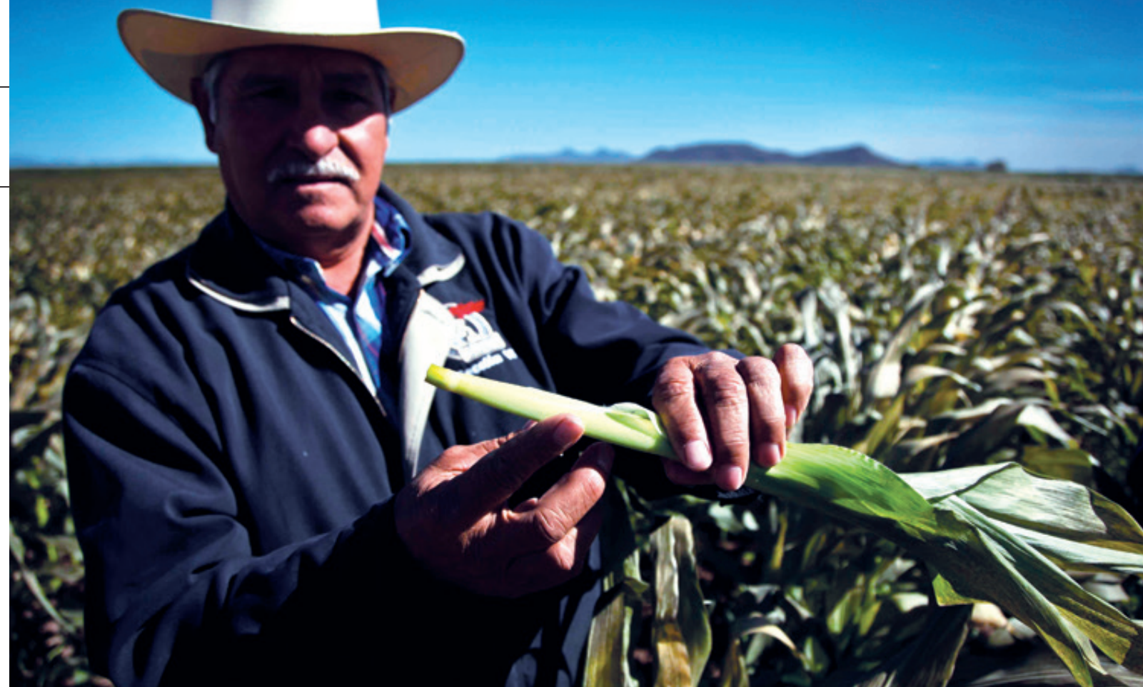
La concentración desigual de los subsidios agropecuarios del gobierno está profundizando la enorme disparidad social, económica y tecnológica que existe entre el norte y el sur de México.

Los productores con menos de cinco hectáreas, de acuerdo con Fundar, se han multiplicado y en los últimos 80 años crecieron el 709 por ciento al pasar de 332 en 1930 a 2.6 millones en 2007, cuando se levantó el último Censo