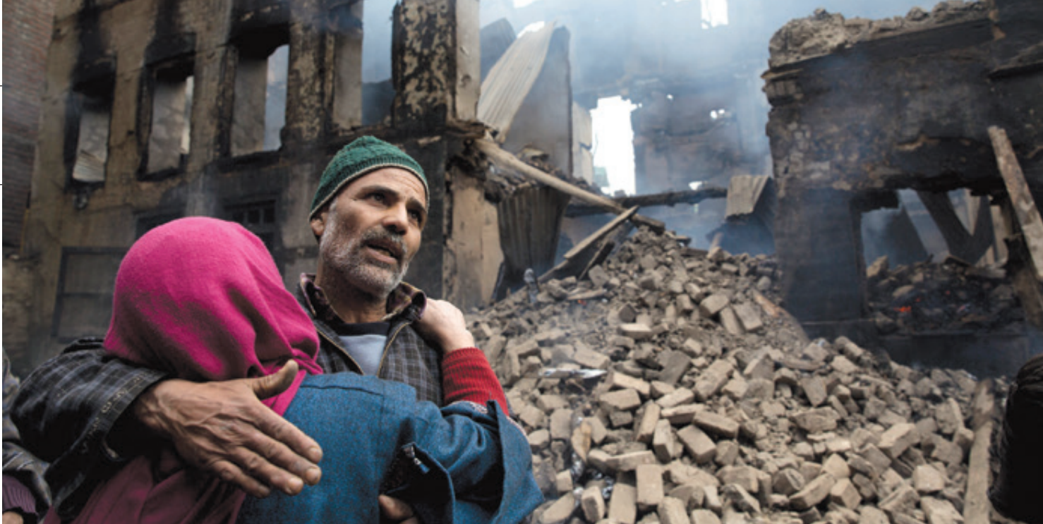
El grupo Jaish-e-Mohammed (JeM), terrorista según EE. UU., y la Organización de las Naciones Unidas (ONU) reivindicaron al peor ataque suscitado en Cachemira, India, en tres décadas y que causó la muerte de 42 personas.

La tensión subió cuando India acusó a Pakistán de “terrorismo transfronterizo” al permitir –y auspiciar– la operación de grupos que atacan objetivos indios y atizan protestas separatistas entre los cachemires. A su vez, las autoridades paquistaníes ordenaron congelar activos de grupos y personas sancionados por la ONU y vocearon que el suelo de Pakistán “no se usará contra nadie”. El cinco de marzo, Islamabad anunció la “detención preventiva” de 44 personas, entre ellas dos