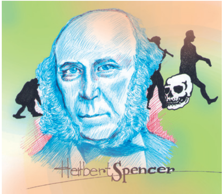
Ilustración: Carlos Mejía

Sin embargo, aclara Gould, Darwin estaba lejos de percibir el uso político que el doblemente “victoriano” imperialismo británico —por la reina Victoria y sus éxitos piráticos en India, China, África y Oceanía— le daría para favorecer su posición ideológica. “Darwinismo social —detalla el biólogo— es un término que a veces sirve para describir cualquier afirmación genética o biológica que se haga sobre la inevitabilidad (o al menos la ‘naturalidad’) de las desigualdades sociales entre clases y sexos, o de las conquistas militares de un grupo sobre otro. Pero esta definición distorsiona la historia de este importante tema e incurre en el uso prominente y enérgico de argumentaciones pseudodarwinistas para cubrir todos estos pecados”.