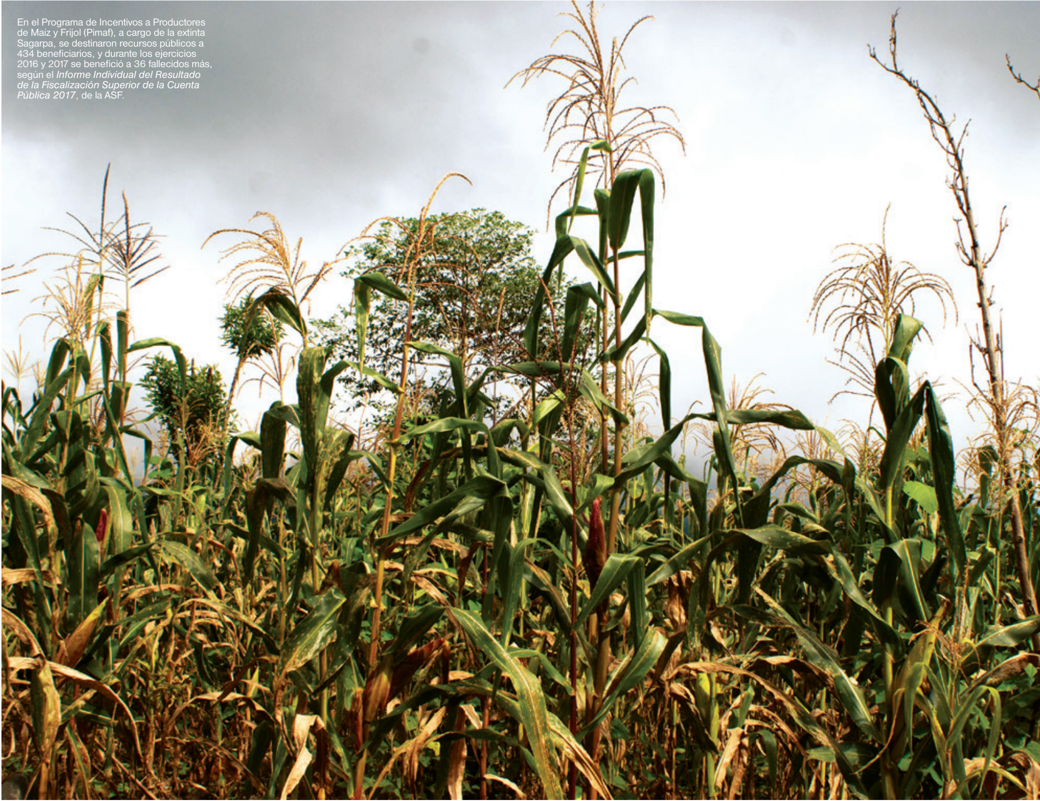
En el Programa de Incentivos a Productores de Maíz y Frijol (Pimaf), a cargo de la extinta Sagarpa, se destinaron recursos públicos a 434 beneficiarios, y durante los ejercicios 2016 y 2017 se benefició a 36 fallecidos más, según el Informe Individual del Resultado de la Fiscalización Superior de la Cuenta Pública 2017 , de la ASF.

Adicionalmente, los auditores, encargados de los programas fiscalizados, recomendaron el fortalecimiento de los procesos de planeación en las actividades sustantivas de los entes auditados, así como mejorar su control interno para minimizar las condiciones que, según su punto de vista, constituyen la causa de las deficiencias encontradas. b