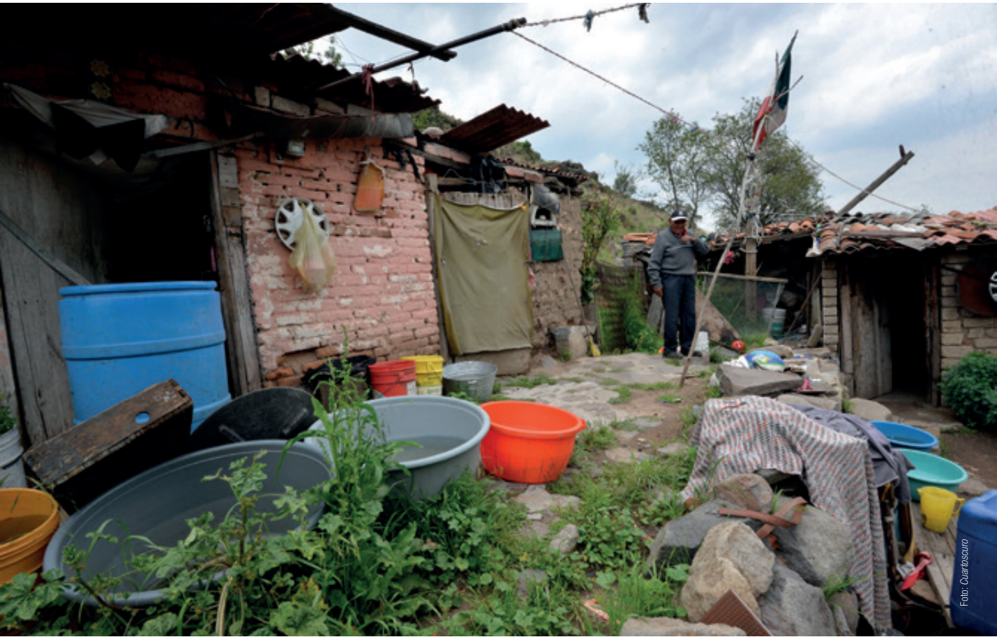
Según la Conapo, de los 16 millones de mexicanos, 11 millones 200 mil viven al día y se encuentran catalogados en alguna de las variantes de pobreza. Además, 43.7 por ciento de la población tiene al menos una carencia social y sus ingresos son insuficientes.

Álvarez Ortiz destacó que su organización “busca que la población despierte y tome conciencia del papel que juega en la sociedad, de cómo a través de la organización popular puede cambiar su entorno y exigir, pacífica y legalmente, servicios básicos para conseguir calidad de vida. Una vez entendido, saben que la pobreza es un problema con raíces más profundas, además que se requiere de un trabajo colectivo”. b