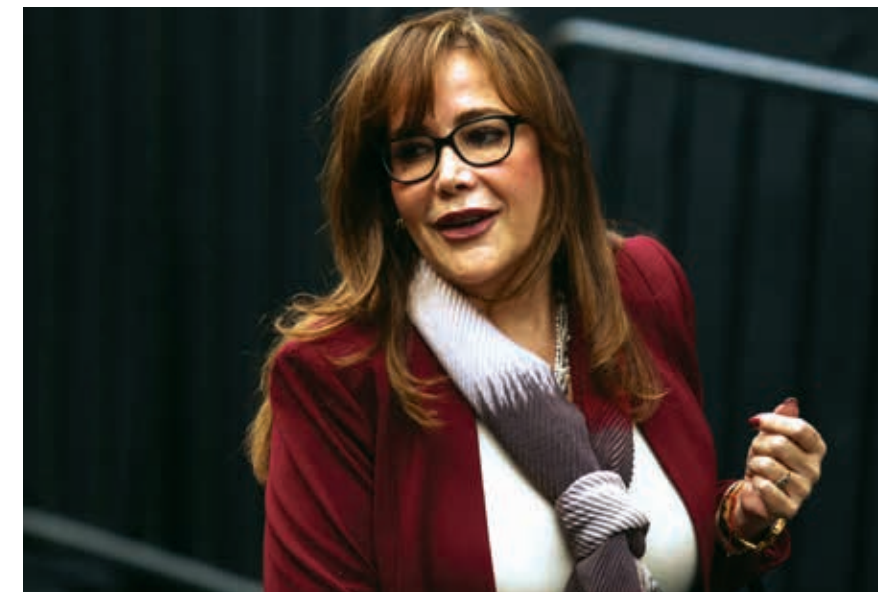
Como una victoria para Yeidckol Polevnsky, líder del CEN de Morena, se puede calificar el nombramiento que el Congreso local hizo de Guillermo Pacheco Pulido como gobernador interino.