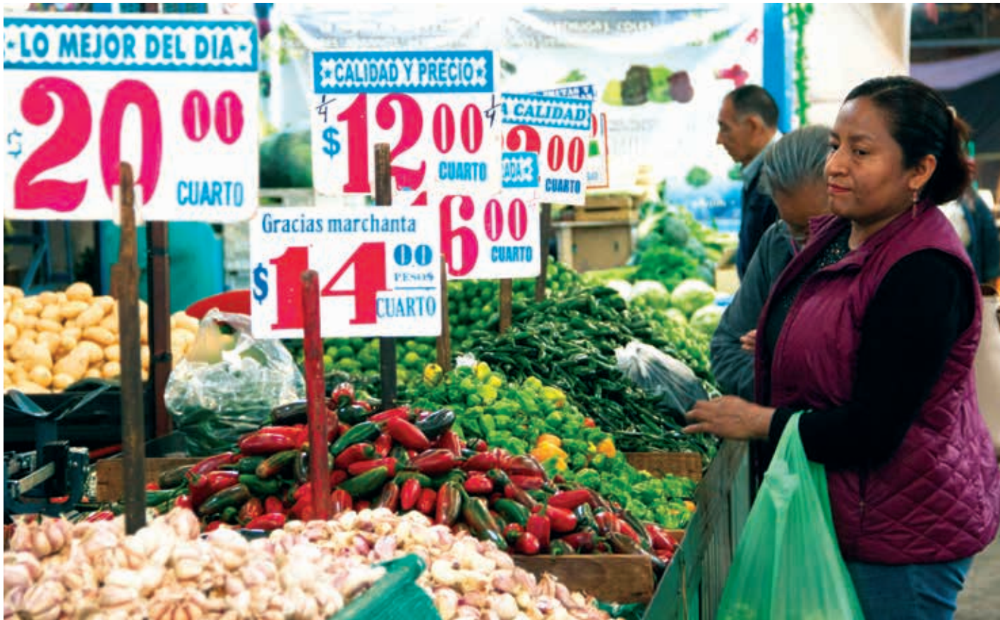
El retraso en distribución de gasolina en algunos estados ha generado un alza en los precios en la canasta básica de alimentos. Distribuidores señalan que el desabasto de combustible dificulta la transportación de los productos. El chile es la legumbre que más ha sufrido esta alza.

C itibanamex aplaudió la decisión gubernamental de limpiar de corrupción la paraestatal, para criticarla días después: “El gobierno afirma que los ahorros generados por combustibles no robados, desde que comenzó la nueva estrategia, superan los costos. Sin embargo, consideramos que los costos de cambiar a una forma menos eficiente de transporte de combustible exceden sus beneficios”.