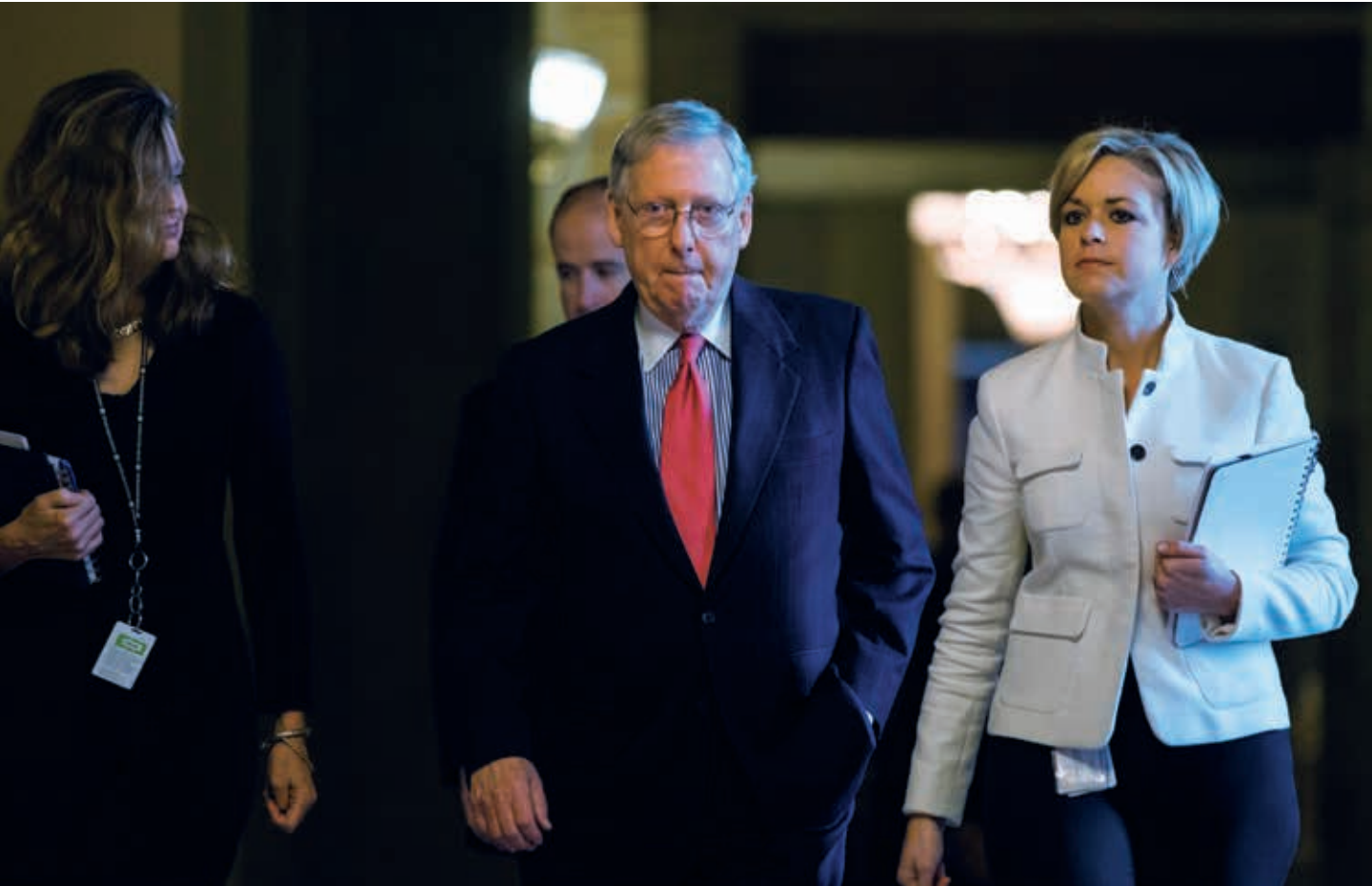
El líder republicano Mitch McConnell anunció su negativa si Trump no la apoyaba (arr.). Alegando el cierre parcial administrativo, el 17 de enero, el presidente estadounidense canceló un viaje oficial al extranjero de Nancy Pelosi (ab.), su adversaria política, la demócrata y presidenta de la Cámara de Representantes.

El cierre administrativo también incide en el control del fenómeno migratorio en aquel país. Unos 20 mil agentes de la Patrulla Fronteriza (BP) trabajan sin percibir salario; y hace dos semanas, agentes de la Oficina de Aduanas y Protección Fronteriza detuvieron en Arizona la mayor ola de inmigrantes indocumentados. Todos ingresaron por túneles excavados bajo el muro fronterizo de San Luis; otros treparon y saltaron la valla existente y una vez en territorio estadounidense se entregaron a la policía fronteriza. b