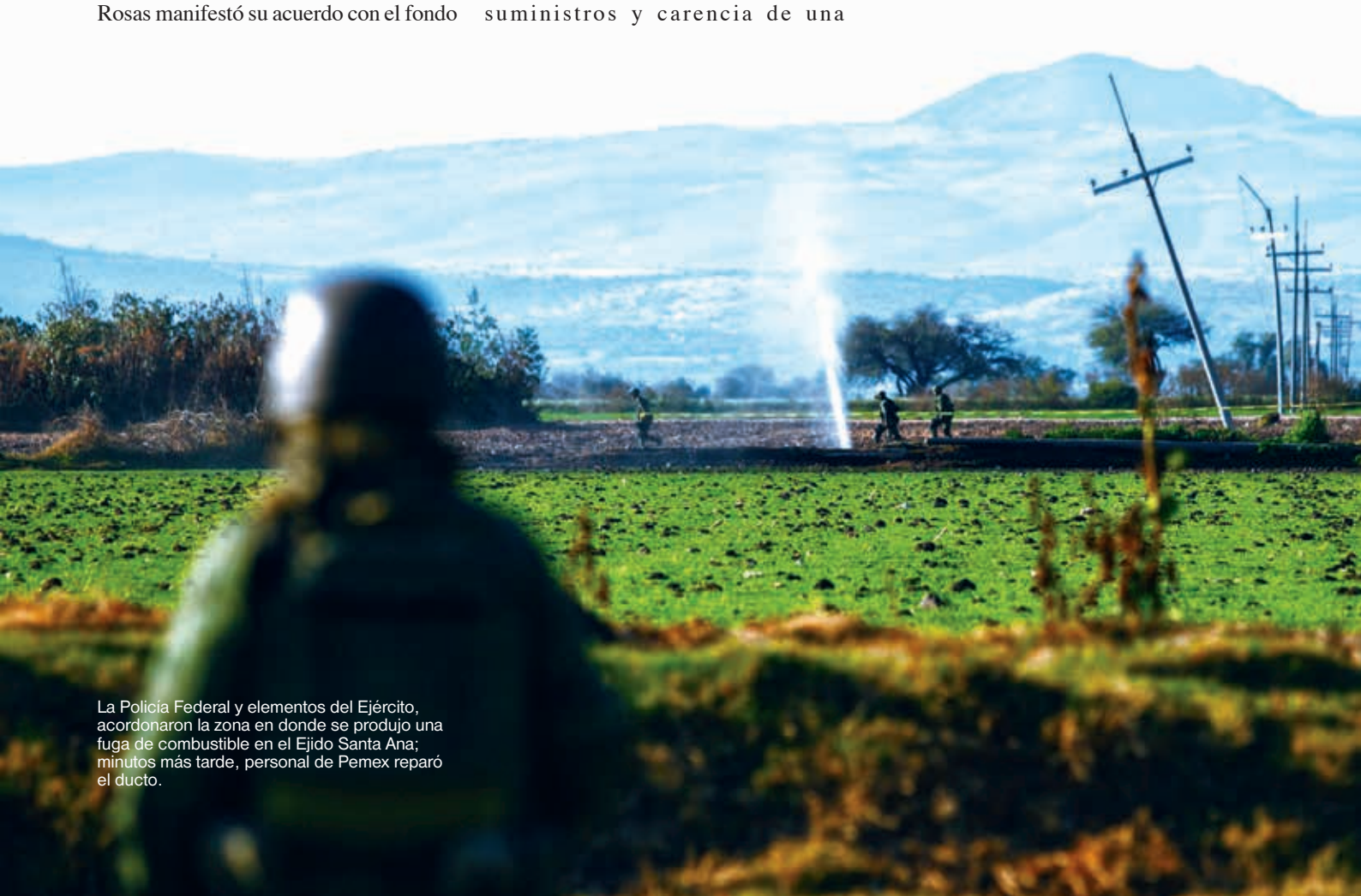
La Policía Federal y elementos del Ejército, acordonaron la zona en donde se produjo una fuga de combustible en el Ejido Santa Ana; minutos más tarde, personal de Pemex reparó el ducto.

El análisis de Citibanamex incluyó posibles escenarios negativos. Los 39 mil mdp en pérdidas se refieren a la prolongación de la perturbación del suministro durante 17 días; cantidad que se restaría al PIB y representa la suma total de las operaciones financieras y mercantiles realizadas anualmente en México. Si se prolongara el desorden en el abasto de gasolina durante 45 días, el daño sería aún mayor y equivalente al 0.3 por ciento del PIB. Si se suspendiera hacia el 17 de enero, se podrían recuperar 13 mil mdp al finalizar este mes y tres mil mdp en febrero. No obstante, el Presidente insiste en que las acciones emprendidas continuarán. b