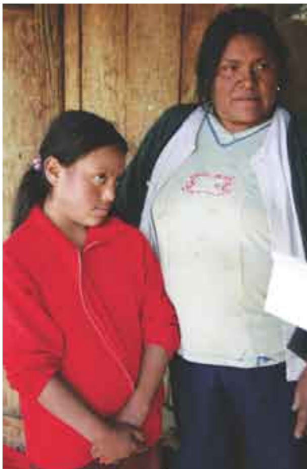
Chabelita. Ejemplo exitoso de atención temprana.

rechos de las Personas con Discapacidad. Ésta fue adoptada por la ONU en 2006 y entró en vigor como derecho internacional. No obstante, organizaciones como Disability Rights International y la Comisión Mexicana de Defensa y Promoción de los Derechos Humanos (CMDPDH), afirman que los derechos fundamentales de niños y adultos con discapacidad son frecuentemente violados y que el Gobierno mexicano no ha invertido lo suficiente para impulsar el desarrollo de este sector.