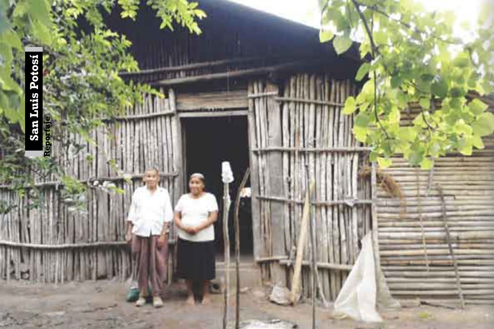
Potosinos pobres exigen menos del uno por ciento del presupuesto estatal para atender necesidades básicas.

el Gobierno estatal este año, de acuerdo con la Ley de Presupuestos Fiscal de Egresos del Estado 2012, se destina un monto cercano a los 29 mil millones de pesos, y los gastos, esos sí excesivos que la Secretaría General de Gobierno hizo el año pasado por más de 750 millones de pesos en la compra de vehículos nuevos, sueldos y prestaciones del personal. Esta dependencia, por cierto, rebasó por más 44 millones de pesos el gasto que tenía autorizado el año anterior, motivo por cual se ganó “una observación” de la Auditoría Superior del Estado (ASE).