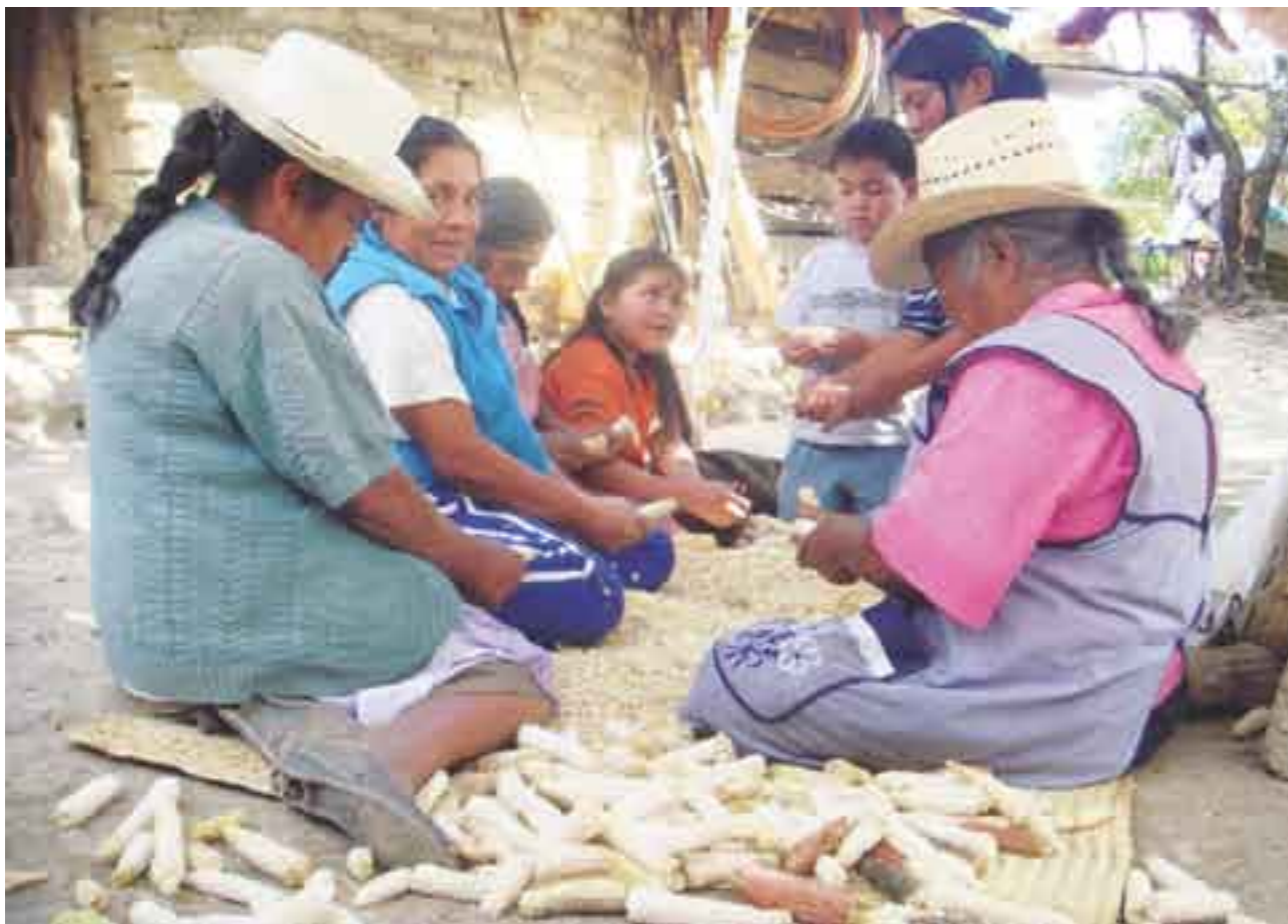
México, condenado a importar y a producir poco y malo, hasta que no apueste por un campo competitivo.

De acuerdo con el organismo internacional, el 88 por ciento del maíz que importa nuestro país proviene de Estados Unidos; el resto, de Asia, Alemania y Corea. La gran dependencia hacia la Unión Americana influirá mucho en el incremento del precio del grano y de la tortilla, alimento básico para la gran mayoría de los mexicanos.