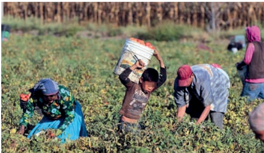
En lugar de disfrutar las actividades propias de su edad, como el juego, el deporte o la convivencia familiar, los niños se ven atrapados en responsabilidades que no les corresponden y que limitan las posibilidades de vivir una infancia plena y saludable.

“Sí es peligroso, una vez casi me caigo de un andamio de cuatro metros, pero ya me acostumbré”, cuenta mientras observa cómo otros trabajadores, a toda prisa, levantan paredes en una casa de la colonia Independencia de Morelia. Y advierte que lo hace por necesidad, pero también con la ilusión de ahorrar. “Quiero comprarme una moto, aunque me gustaría estudiar mecánica”, admitió.