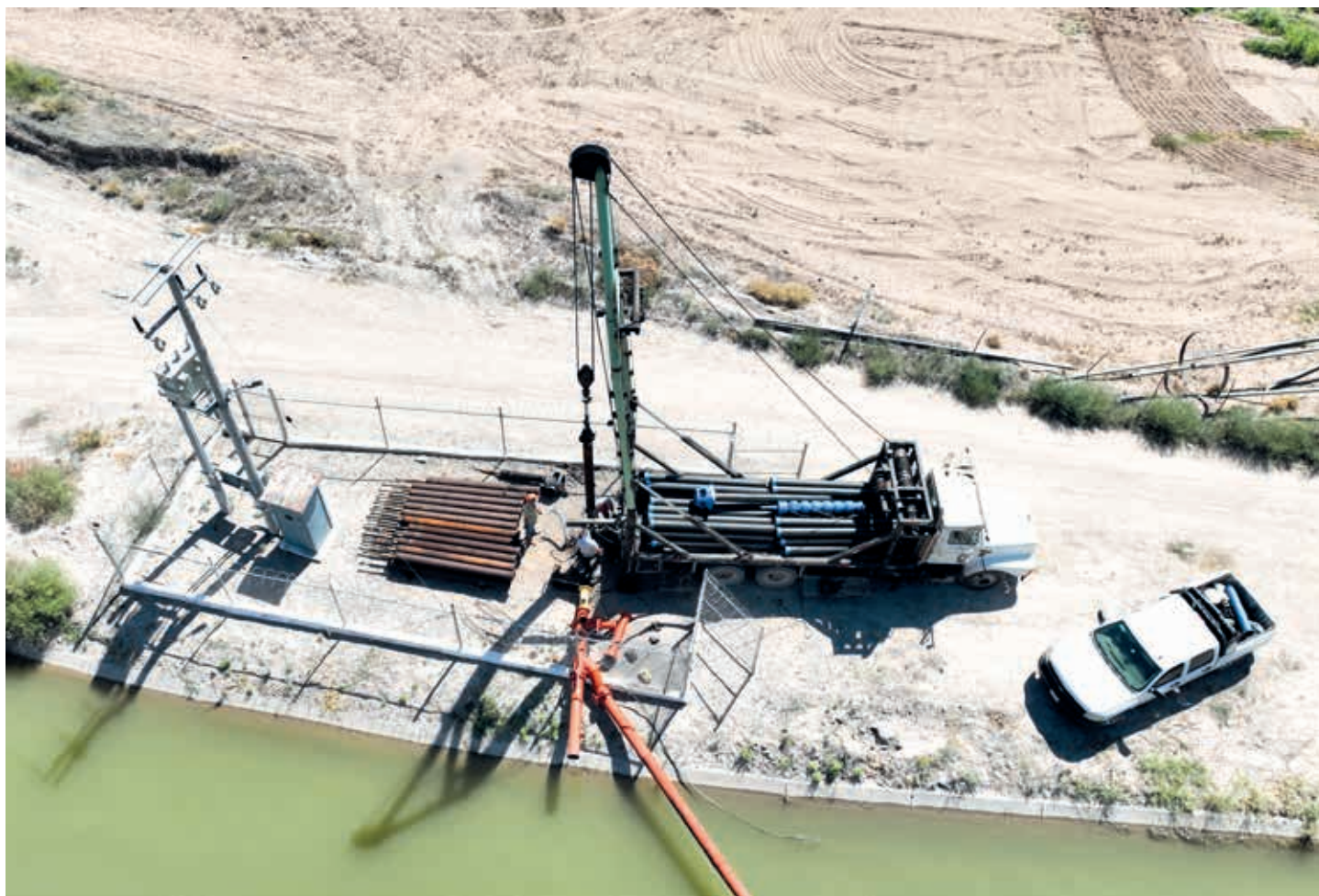
El crecimiento poblacional e industrial en las ciudades fronterizas ha incrementado la presión sobre los recursos hídricos, volviendo el acuerdo aún más insostenible.

trasvases necesarios. Pero la decisión no será técnica, sino política: cumplir implica sacrificar agua agrícola en el norte, mientras no hacerlo podría detonar represalias económicas o diplomáticas en un entorno de creciente hostilidad.