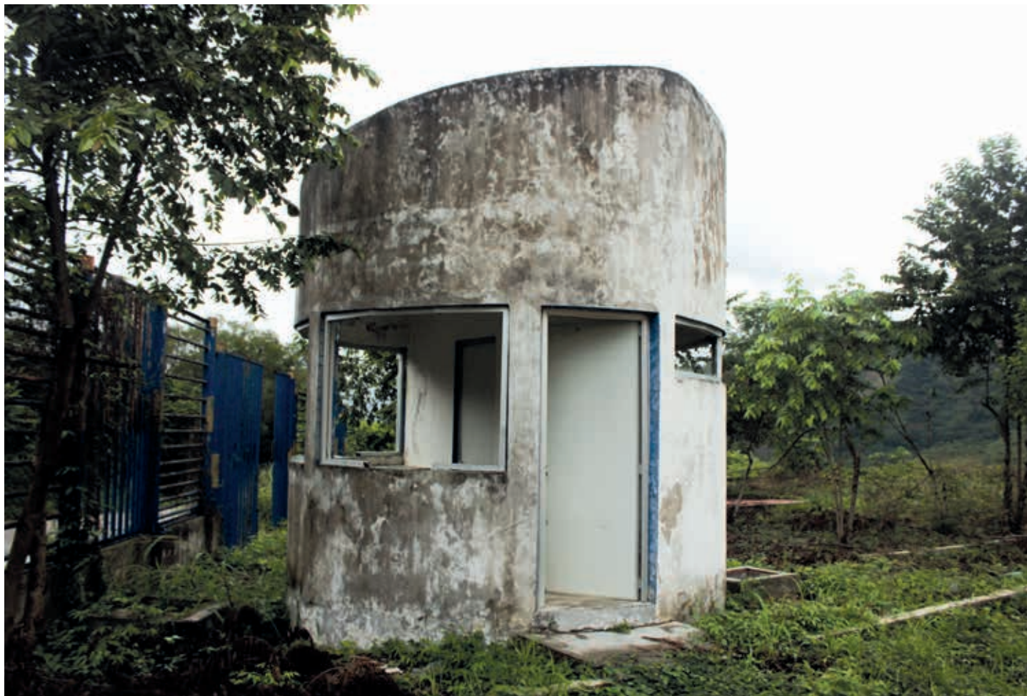
La infraestructura de la UNACH permanece en ruinas, desmantelada, pero con una esperanza: que el espacio donde está podría reactivarse y ofrecer un mejor futuro a las nuevas generaciones de Simojovel y de la región de Los Bosques.

que hay una cantidad importante de alumnos provenientes de localidades de alta y muy alta marginación donde la principal fuente de empleo para sus padres es la actividad agrícola; por eso respalda que en el municipio se instale una universidad, un espacio que beneficiaría a los estudiantes e impulsaría su formación académica.