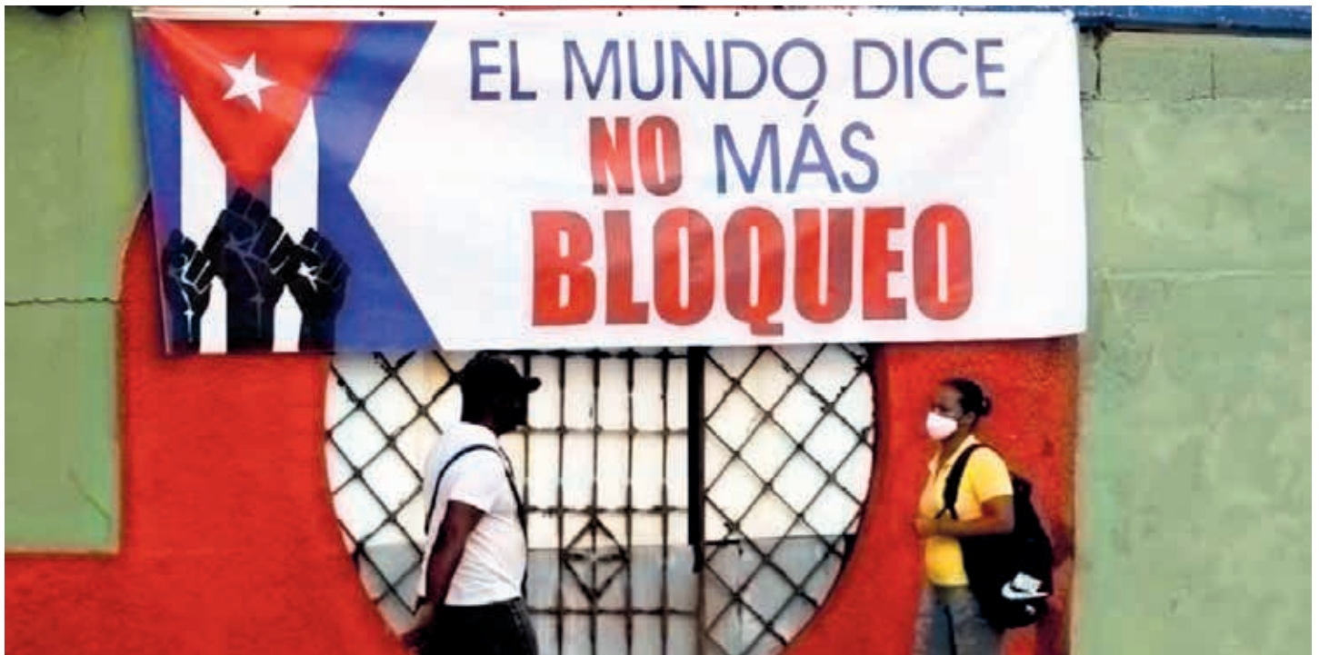
Washington difunde la falsa versión de que Cuba apoya al terrorismo, lo que influye sobre el ámbito financiero en la paridad y tipo de cambio del peso.