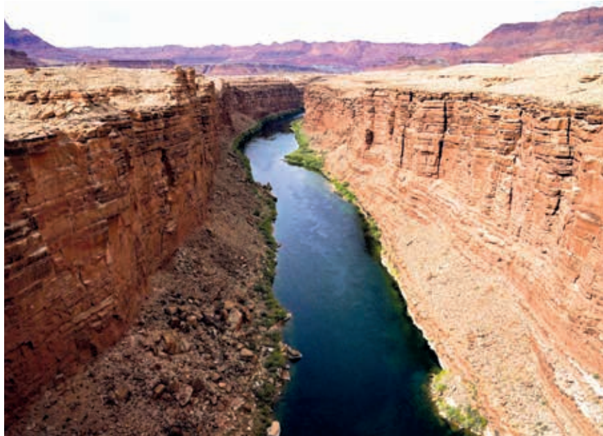
El tratado establece que EE. UU. debe entregar a México un volumen anual de mil 850 millones de m 3 de agua del río Colorado. Esta entrega se realiza a través de una estación ubicada cerca de Yuma, Arizona, con destino al estado mexicano de Baja California.

Autoridades en Texas expresaron su preocupación por el impacto de la falta de agua en sus agricultores, mientras